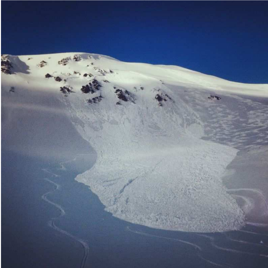
Allau accidental cara sud del Monturull (Perafita-Puigpedrós) caiguda el dia 31 de gener (Autor: Samuel Colomer).