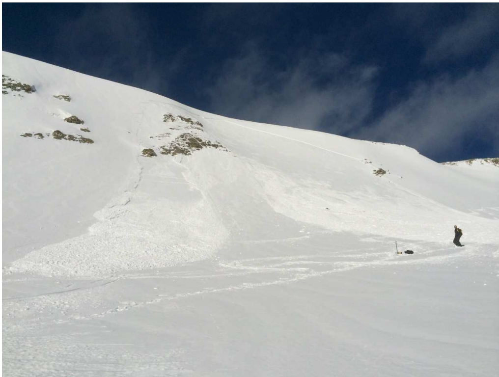
Allau accidental al pic de Xemeneis (Ter-Freser), ocorreguda el dia 30 de gener.

Hi ha algunes allaus accidentals de placa de mida petita (D1 i D2) i mitjana (D3) a diversos sectors (Perafita-Puigpedrós, Ter-Freser, Ribagorçana-Vall Fosca), i al final de la setmana allaus petites de neu recent degut a les nevades acabades de caure.