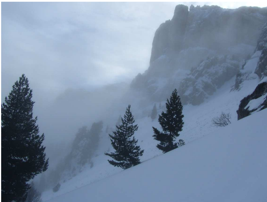
Hi ha hagut molts dies amb núvols baixos que han humitejat el mantell per sota dels 2000-2200 m. Canals del Cadí el dia 2 de gener de 2014.