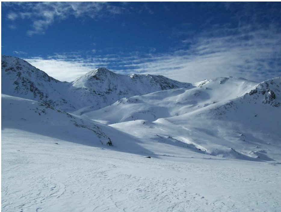
Aspecte de la vall de Filià (Vall Fosca) el 31 de desembre de 2013, on el gruix de neu s'ha recuperat clarament en comparació amb la situació d'abans de Nadal.