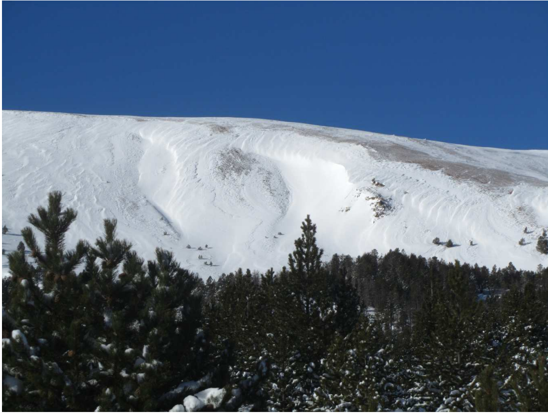
Aspecte del Coll de la Barra (Perafita-Puigpedrós) el dia 27 de desembre, ventat amb plaques de vent en orientacions est i sud. Fixeu-vos en l'ondulació sobre la superfície de la neu, resultat de l'acció del vent: indica que són plaques de vent.