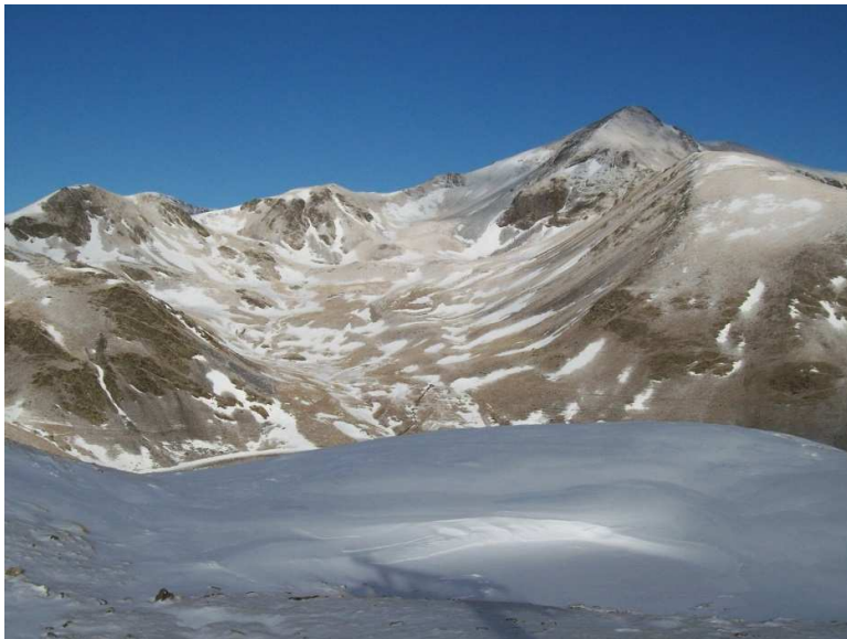
Aspecte de la vall de Filià (Vall Fosca) el divendres 20 de desembre, amb una innivació molt per sota de l'habitual per l'època.

Acaba la setmana amb un temps novament anticiclònic; feble encrostament de les solanes i les obagues es mantenen amb neu pols.