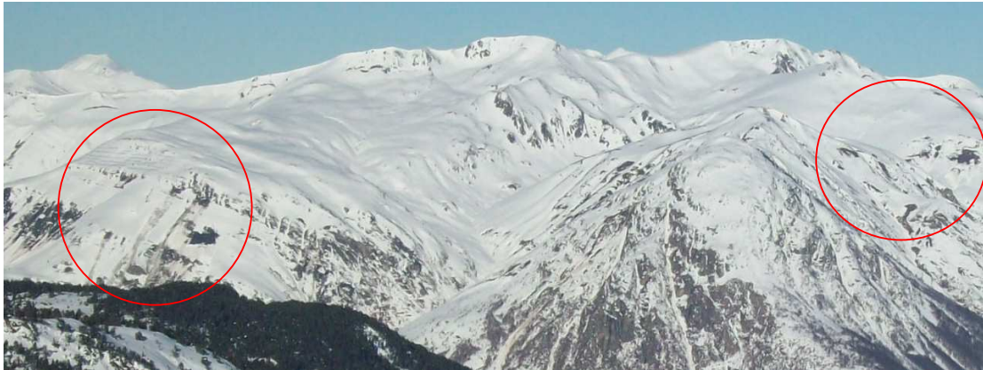
A les solanes de l'Aran, a finals de setmana es veuen les restes de força allaus de lliscament (cercles vermells), dijous 5 de desembre.