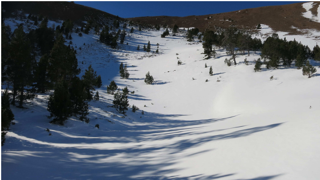
Al Pirineu oriental, el mantell només és esquiable amb continuïtat per sota del límit superior del bosc, a recer del vent de nord que ha bufat bon apart del novembre i que ha deixat les cotes per damunt de 2300 ben pelades, a excepció de punts sota colls i carenes en sud, ben carregades de neu ventada. Coll de la Barra (Perafita-Puigpedrós) el dijous 6 de desembre.