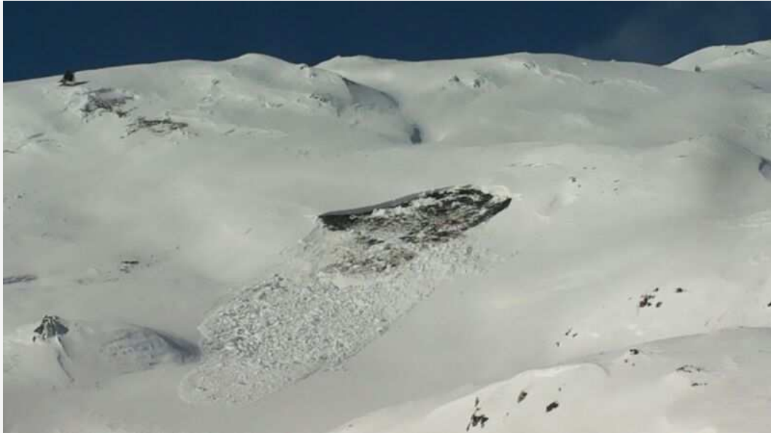
Alud de deslizamiento o de placa de fondo caída en Beret (Aran-Franja Norte de la Pallaresa) entre el sábado 30 de noviembre y el domingo 1 de diciembre.