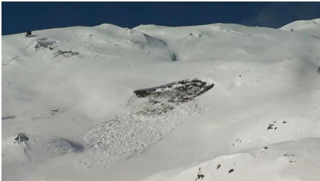
Allau de lliscament o de placa de fons caiguda a Beret (Aran-Franja Nord de la Pallaresa) entre dissabte 30 de novembre i diumenge 1 de desembre.