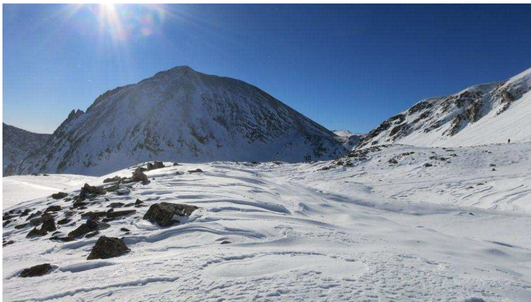
Aspecte de la neu molt ventat (Ter-Freser, 26 de novembre). Es manté la base gràcies a la nevada humida de llevant.