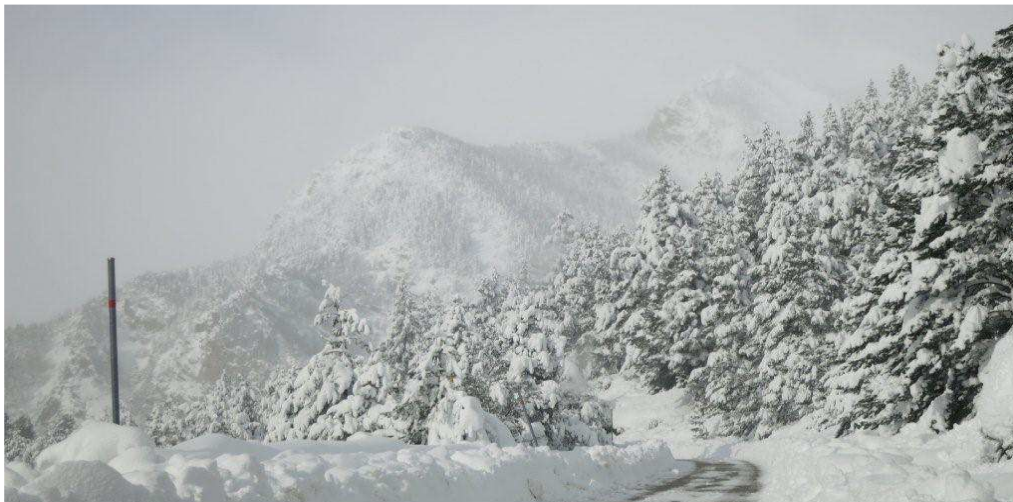
Carretera d'accés a Vallter 2000 el dimarts 19/11/2013 al matí després de la llevantada (Ter-Freser).