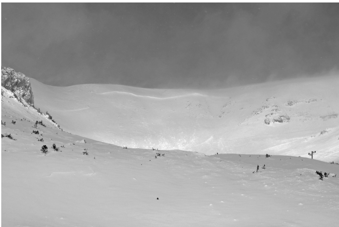
Allau de placa al pic de Xemeneies (Ter-Freser) caiguda el dimecres 20/11/2013 per transport de neu per vent. Al primer pla es veuen les restes del dipòsit de l'allau.