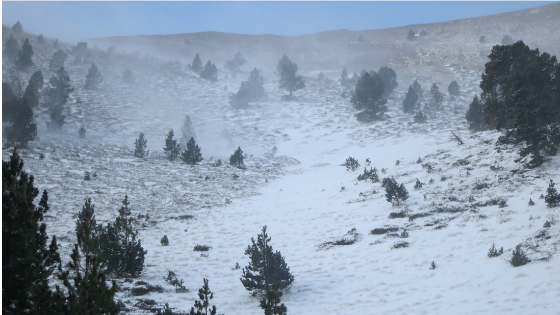
Distribució del mantell nival al Coll de la Barra (Perafita-Puigpedrós), divendres 15/11/2013, abans de les nevades de llevant.