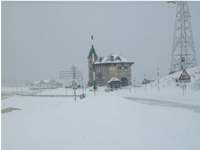
La nevada de nord al Port de la Bonaigua (Aran-Franja Nord de la Pallaresa), 15/11/2013.