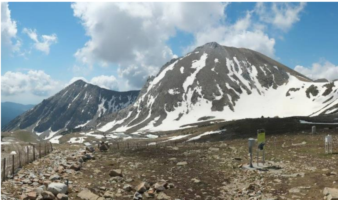
Aspecte del mantell a Vallter, el 23 de maig. Apareixen congestes i una mica de continuïtat al coll de la Marrana.