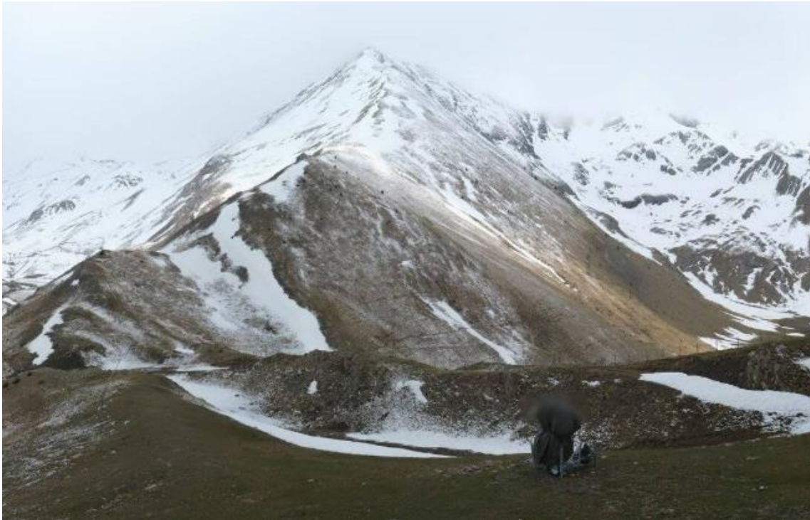
Enfarinada des de Boí-Taüll (Ribagorçana), amb la Pica Cerví de Durro, al fons, el 18 de maig.