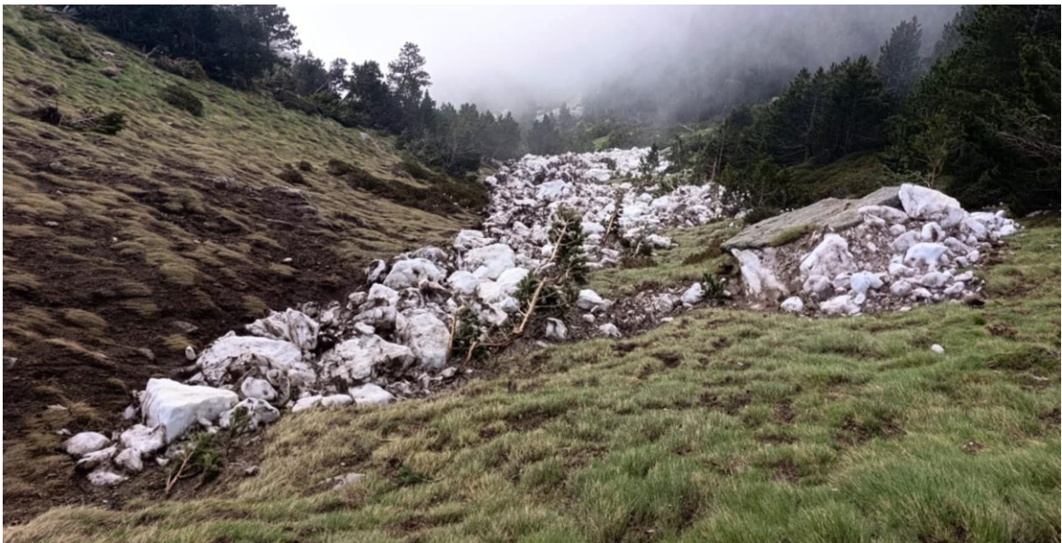
Detall del lliscament basal del pla de Sallent. L'allau és de mida 2 (mitjana), amb capacitat de cobrir una persona.