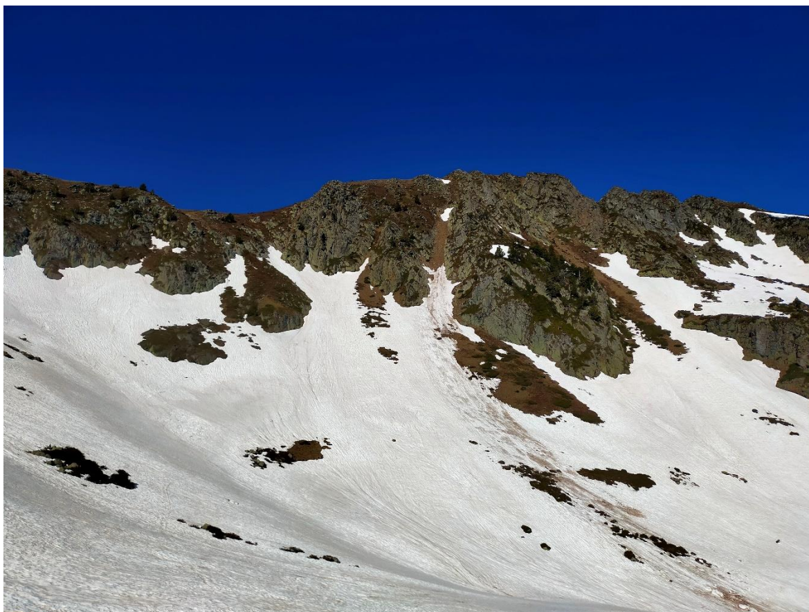
Aspecte del mantell a Tavascan, el 12 de maig. Apareix la neu vella, primavera, amb restes d'un lliscament basal antic, a un vessant orientat a l'est.