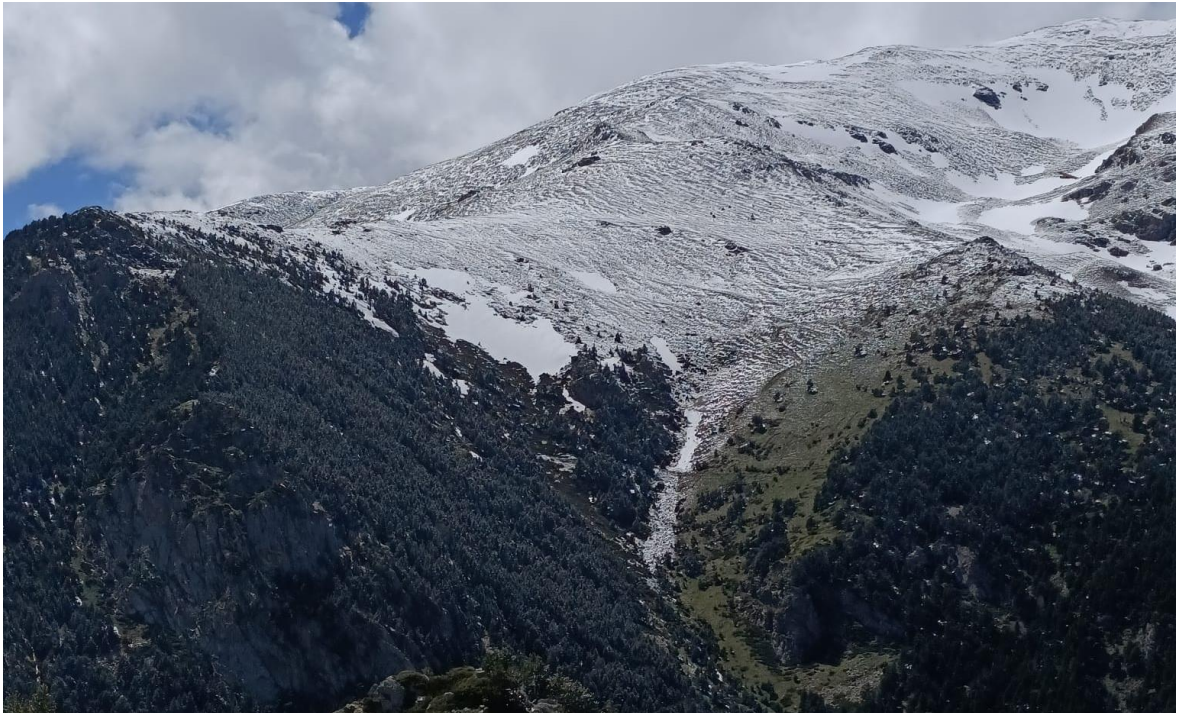
Allau de lliscament basal observat el 16 de maig al pla de Sallent, al camí de Fontalba (Núria). L'allau és de dies enrere, possiblement desencadenat durant un episodi de pluja anterior.