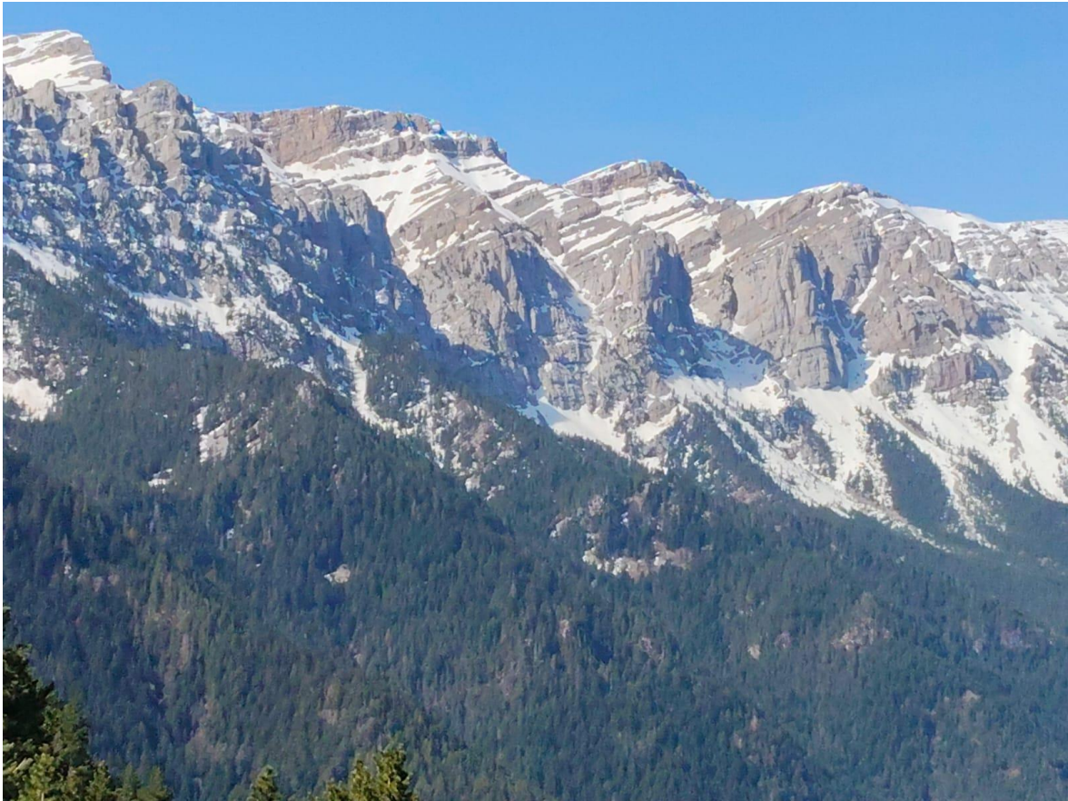
Imatge del vessant nord del Cadí i, en primer pla, la Roca de l'Ordiguer i la Canal del Cristall, el 21 d'abril. La disponibilitat de neu va minvant, i només trobem continuïtat dins de les canals, a les obagues.