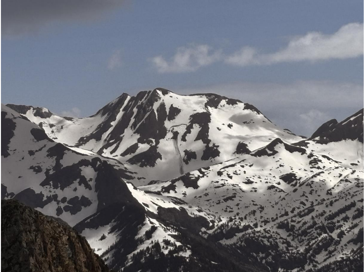
Lliscament basal al massís de Certascan (Franja Nord Pallaresa), observat des de Tavascan, el dia 25 d'abril.