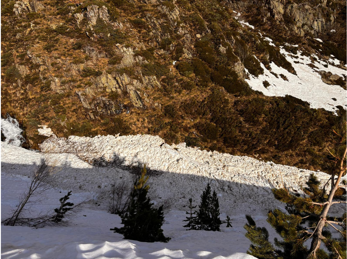
Dipòsit d'un lliscament basal observat a Tavascan (Franja Nord Pallaresa), el 25 d'abril.