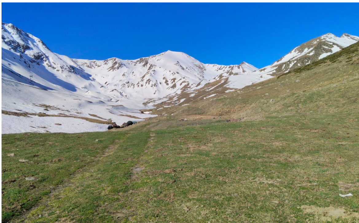
Paisatge de la Vall de Filià (Ribagorçana-Vall Fosca) dijous dia 16 d'abril. A 1.900 m la cobertura nival és encara continua a terreny obac però ja és inexistent a solanes i sectors drets rocosos. La present temporada ha estat destacable per l'elevat nombre de dies en què el mantell ha estat esquiable a vessants sud a aquest sector.