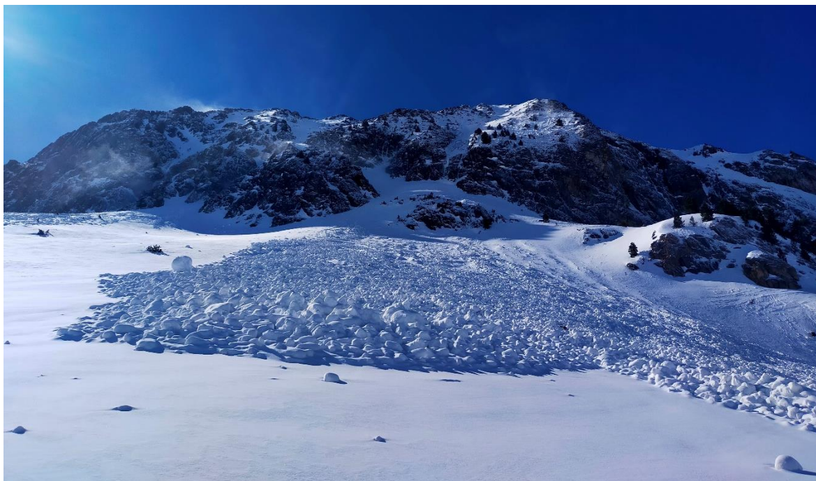
Imatge d'una allau de neu humida a Beret (Aran-Franja Nord de la Pallaresa), dimarts 14 d'abril. Va caure de manera natural i va assolir mida 3.