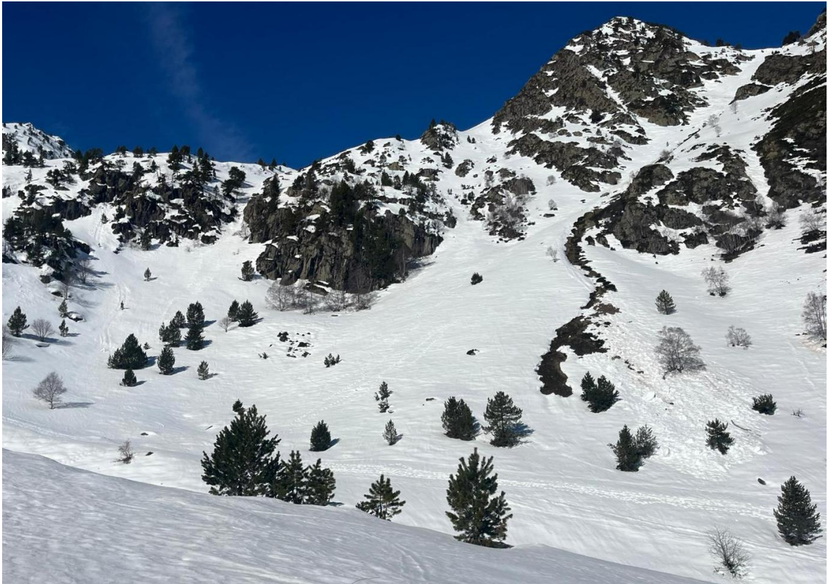
Imatge del 25 de març al sector de la Franja Nord de la Pallaresa amb diverses purgues de neu humida i caiguda de boles durant l'episodi d'elevades temperatures i alta insolació.