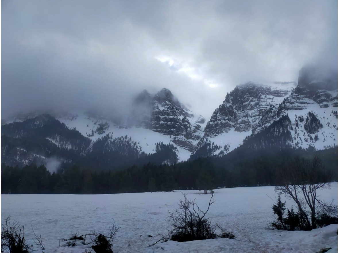
Imatge de paisatge de les Canals del Cadí dijous 19 de març. Les boires van contribuir a l'humitejament superficial de la neu.