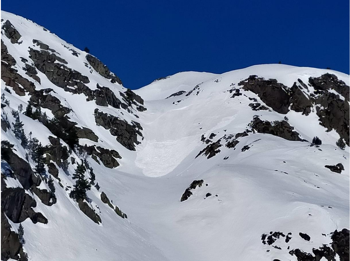
Allau de placa tova caiguda a la Canal de l'Ós, a Tavascan (Franja Nord de la Pallaresa). La caiguda, natural, va tenir lloc el dia 17 de març.