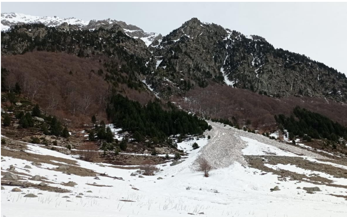
Allau de neu humida (possible lliscament basal), vist des del Pla de Mulleres, desencadenat de manera natural a una de les canals del Tuc del Porth de Vielha (Aran), a un vessant oest, del dia 11 de març.