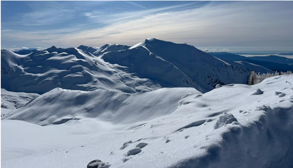
Mantell continu i amb una mica de regel superficial, des de Boí (Ribagorçana), el 10 de març.