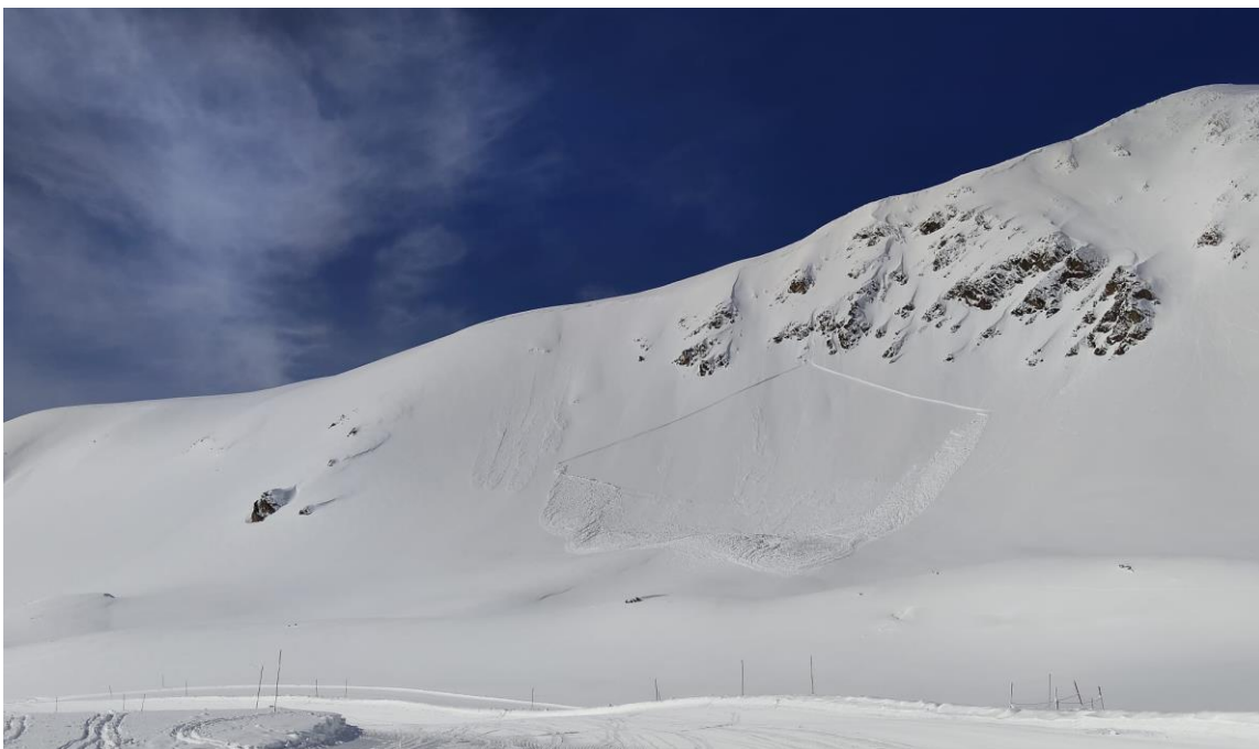
Allau natural de neu recent, de mida 2 (mitjana), als contraforts del cim del Bastiments (Ter), el 9 de març.

Trobem neu a l'Aran-Franja Nord Pallaresa per damunt d'uns 1.400 a obagues i 1.700 m a solanes. Els gruixos a uns 2.200 m són superiors als normals a la Franja Nord de la Pallaresa i a la meitat sud de l'Aran on volten els 180-220 cm. A la meitat nord de l'Aran hi ha uns 120-140 cm de gruix total. A la resta de sectors del Pirineu Occidental hi ha neu al terra a 1.600 m en N, i a 1.800-1.900 m en S. El mantell és esquiable per damunt d'uns 1.800-1.900 m a obagues. Els gruixos assoleixen els 110-160 cm, en general, a 2.300 m. Al Pirineu oriental hi ha neu al terra per sobre de 1.600-1.700 m. És esquiable a partir d'uns 1.700 m i presenta gruixos molt excedentaris per l'època de l'any que oscil·len entre 85-105 cm a uns 2.000 m i més de 150 cm per sobre de 2.400 m, per exemple, al Ter-Freser. Al Vessant Nord del Cadí-Moixeró els gruixos estan al voltant de 160-180 cm, a 2.200 m i al Prepirineu es mouen entre els 65 i els 85 cm, a 2.200 m.