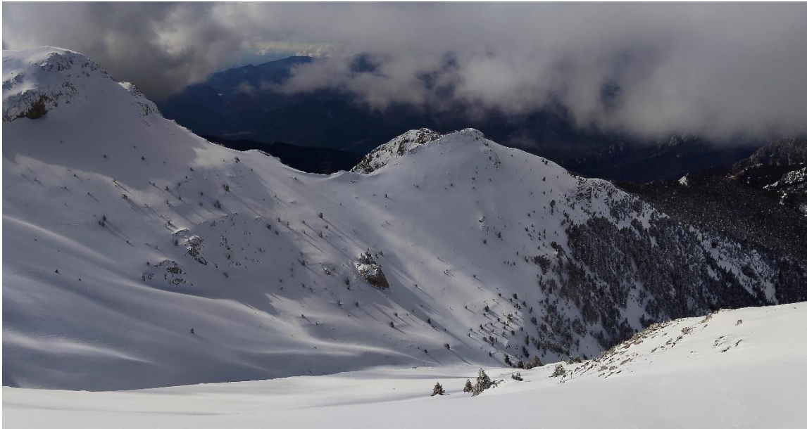
Mantell regular i abundant, des de la Vall Fosca, el 10 de març.