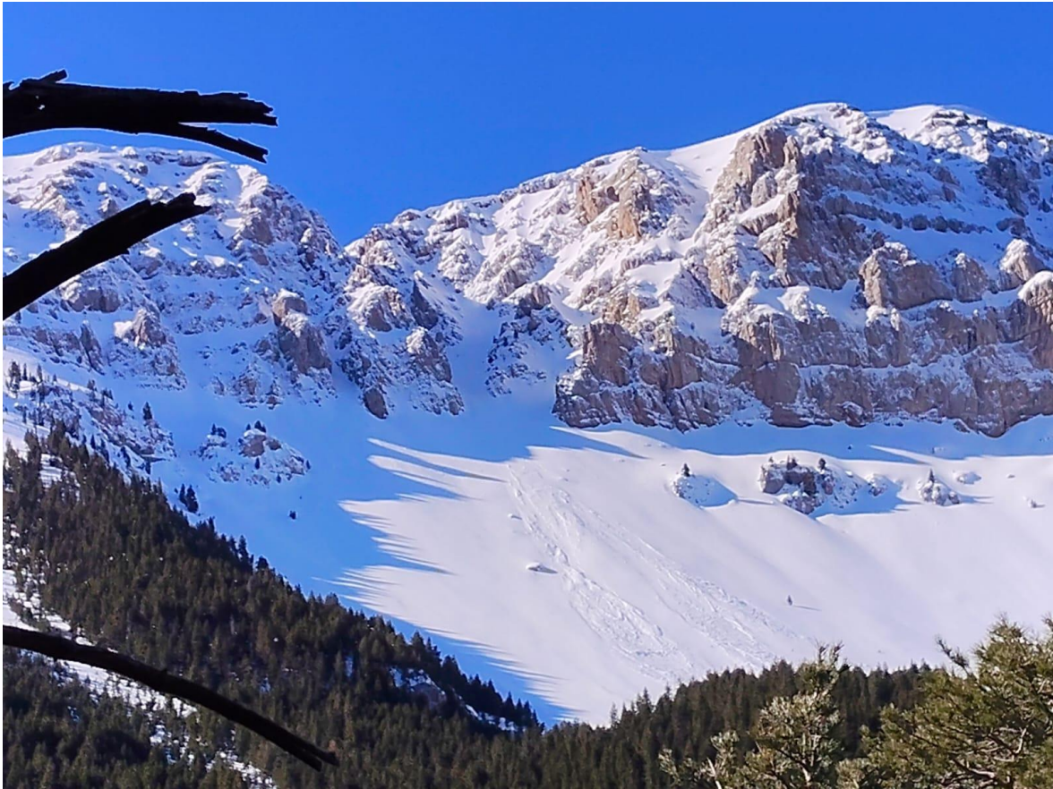
Allau de neu humida, natural, de mida 2 (mitjana), a la Canal Baridana (Vessant Nord del Cadí), observada el 13 de març.