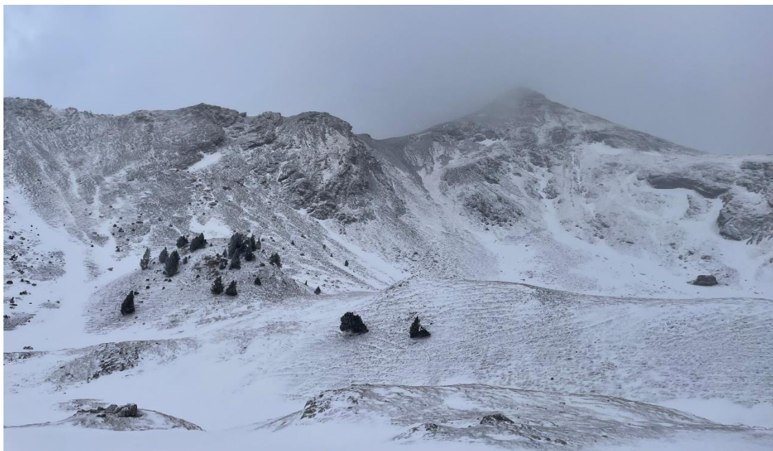
Paisatge escombrat pel fort vent del nord-oest, a Espot-Picardes (Pallaresa). La intensa ventada va generar moltes deflacions i va deixar el terra nu a molts vessants exposats.