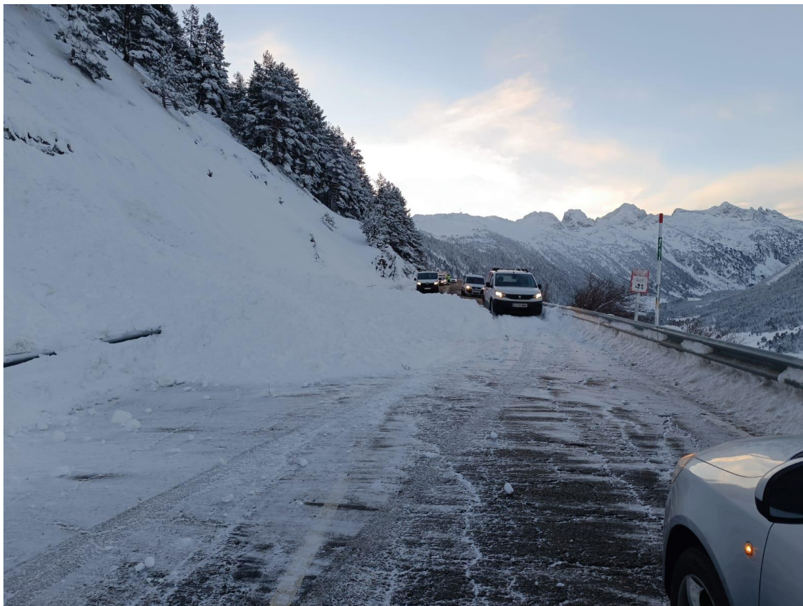
Dipòsit d'una allau de neu humida que va tallar els dos carrils de la C-28, al port de la Bonàigua (Franja Nord Pallaresa), el dia 12 de desembre.