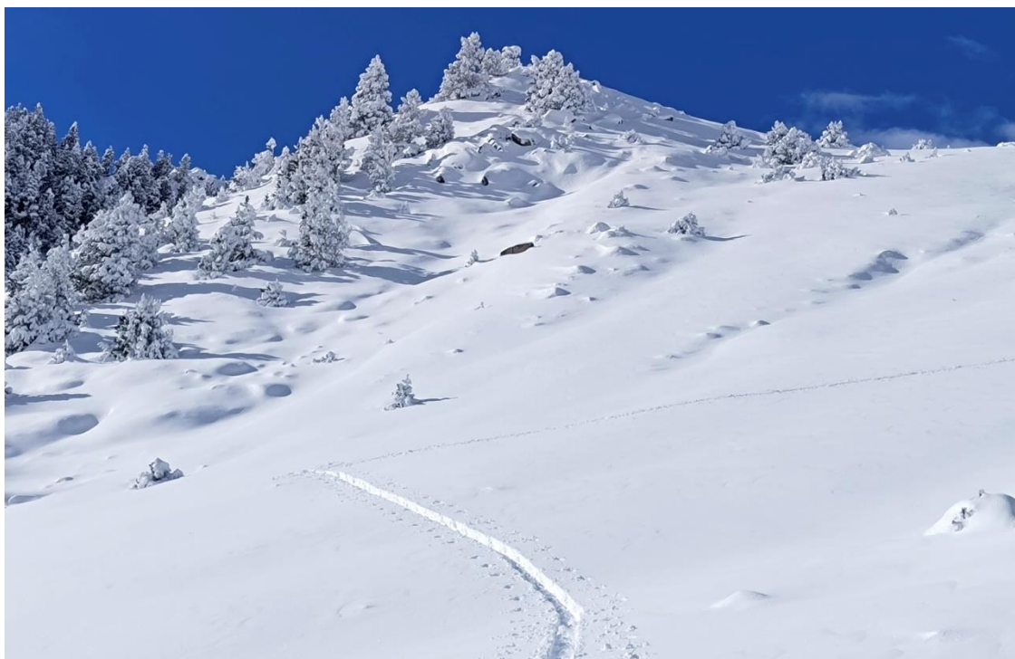
Neu recent el dia 13, després d'un parell de nevades que van acumular fins a 40 cm a Vallter.