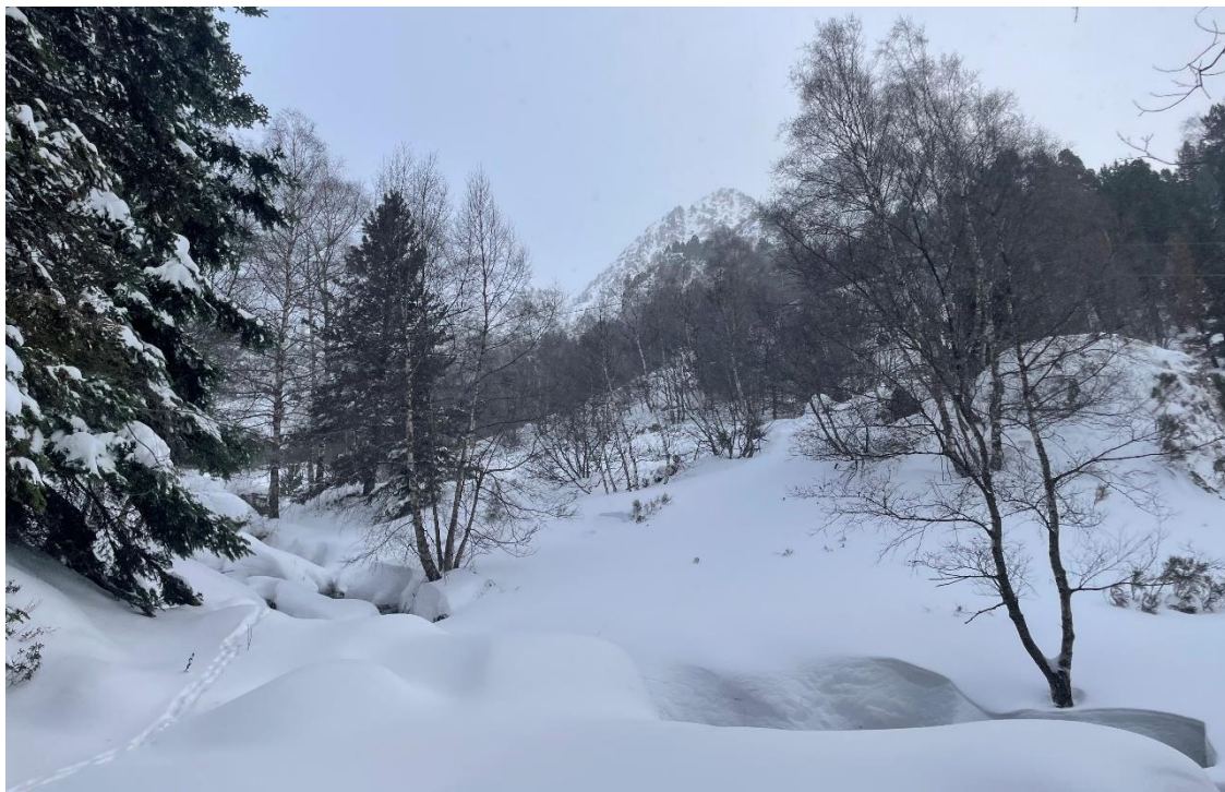
Neu recent corresponent a la nevada que va acumular de 50 a 70 cm a Tavascan i sectors propers (Franja Nord Pallaresa). La imatge és del dia 10 de desembre.