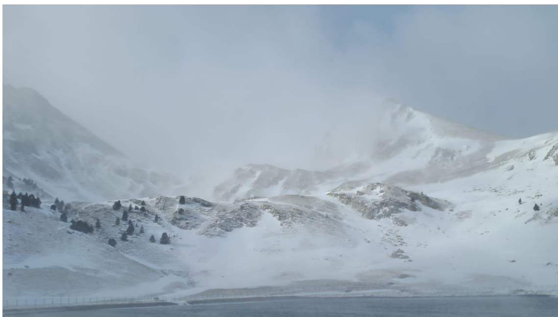
Imatge 3. Torb damunt del Bony de les Picardes (Pallaresa). La nevada del 9 de desembre va anar acompanyada de fort vent que va aixecar i mobilitzar la neu, generant nombroses deflacions i també acumulacions als vessants a sotavent.