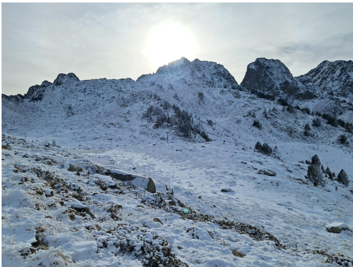
Imatge 2. Paisatge des de l'estació automàtica de la Bonaigua (Franja Nord Pallaresa) amb un mantell escàs, el dia 5 de desembre.