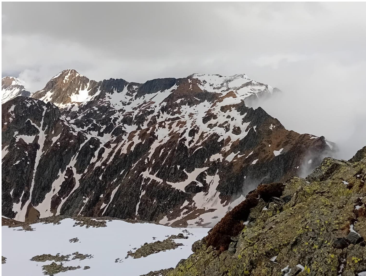
Mantell present, de manera discontinua a partir dels 2.100-2.200 m, fora de les obagues, a la Franja Nord de la Pallaresa, el dia 23.