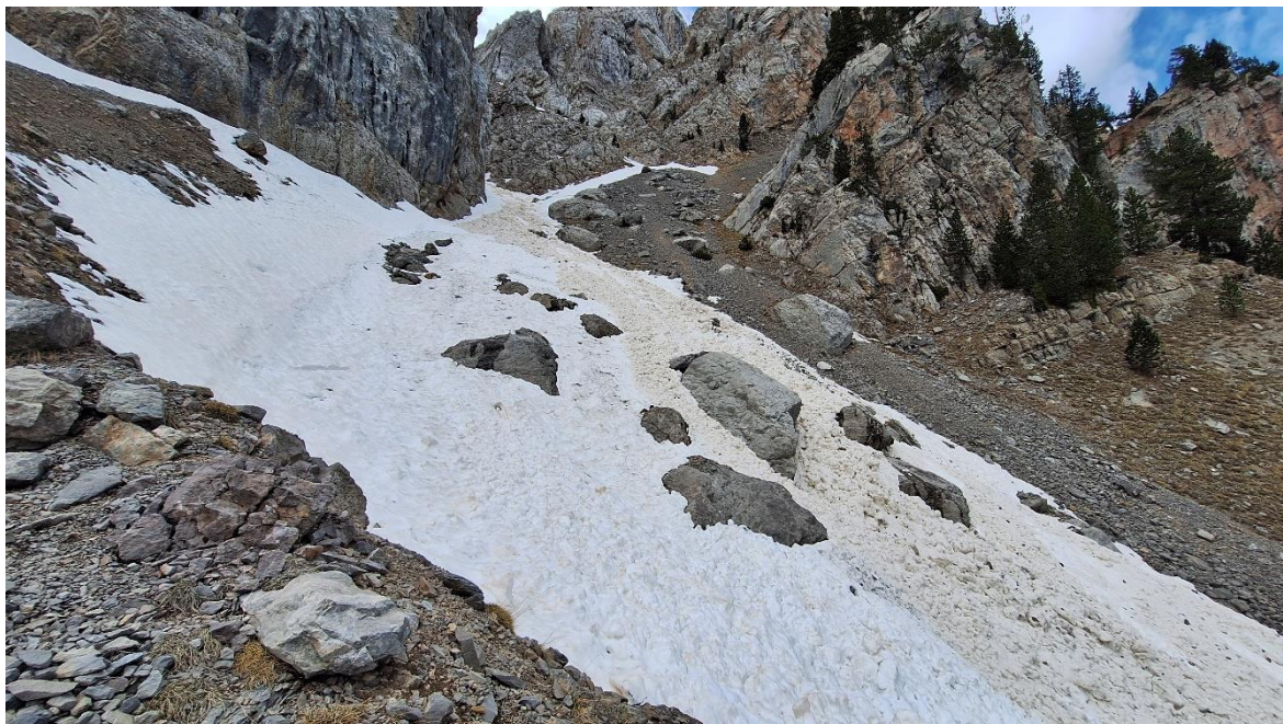
Restes d'un dipòsit antic d'una allau de fusió a la canal de l'Ordiguer (Vessant Nord del Cadí), el dia 13 de maig.