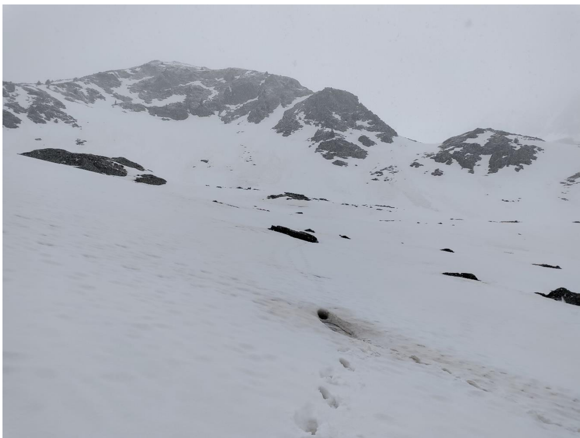
Mantell continu a partir dels 2.300 m a Tavascan (Franja Nord de la Pallaresa), amb algunes allaus de neu humida, de mida 1 (petita), el dia 14 de maig.