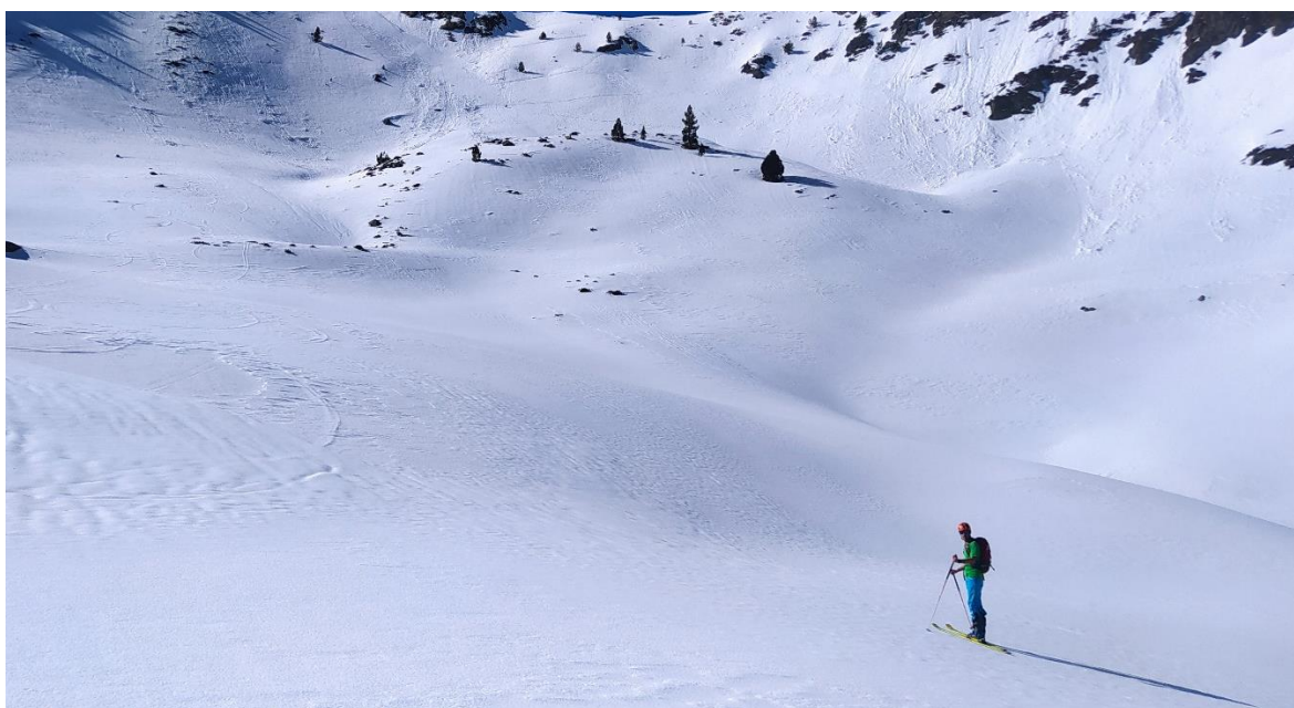
Mantell continu, amb un aspecte hivernal, a Tavascan (Franja Nord de la Pallaresa), el dia 9 de maig.