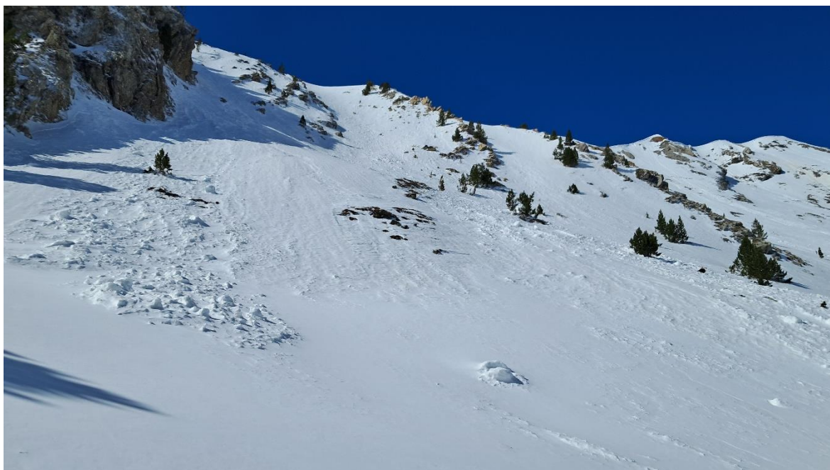
Dipòsits antics d'allaus observades a Espot (Pallaresa), el dia 8 de maig.