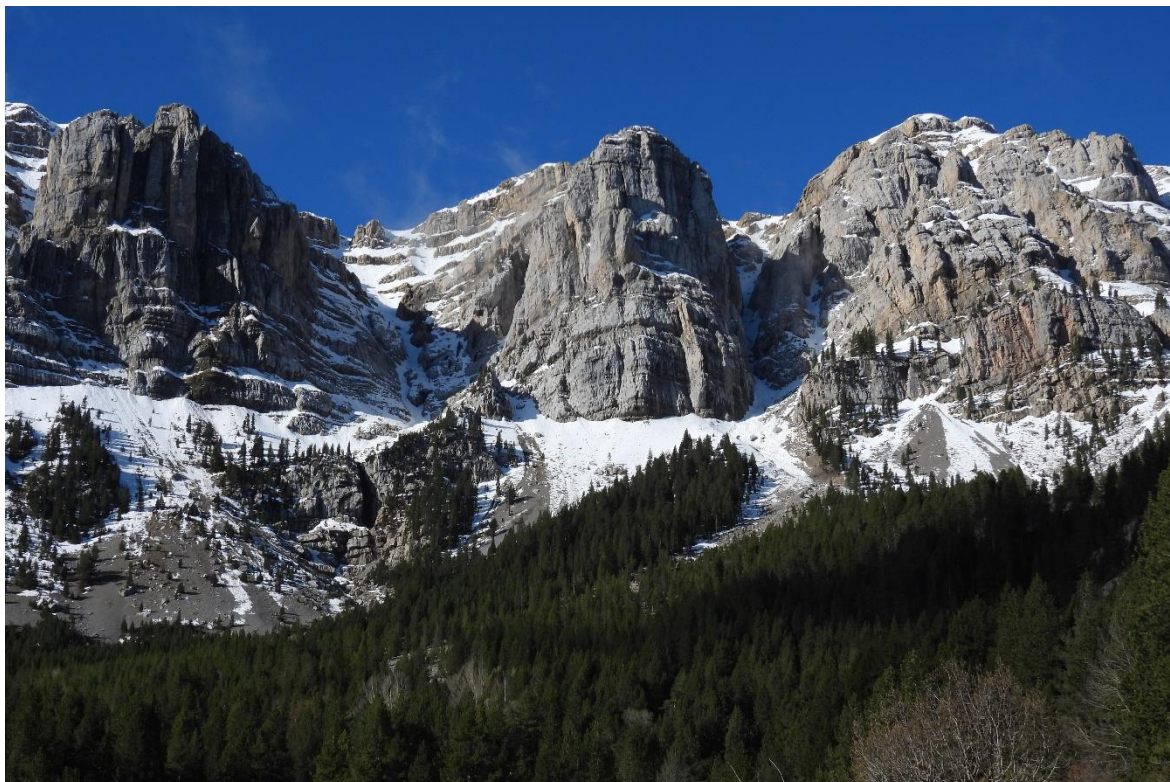
Mantell escàs, amb neu a terra a partir dels 2.100 m al Vessant Nord del Cadí, el dia 6 de maig.