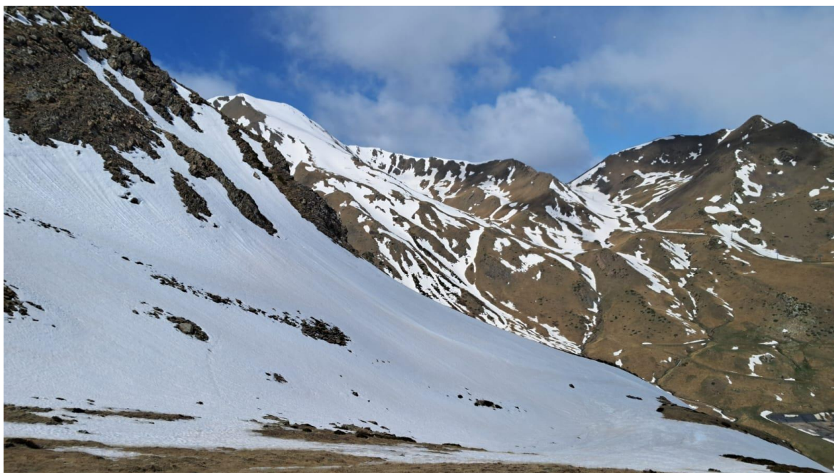
Mantell present només a obagues, a Filià (Vall Fosca), el dia 18 d'abril. A les solanes hi ha molta discontinuïtat o algunes congestes.