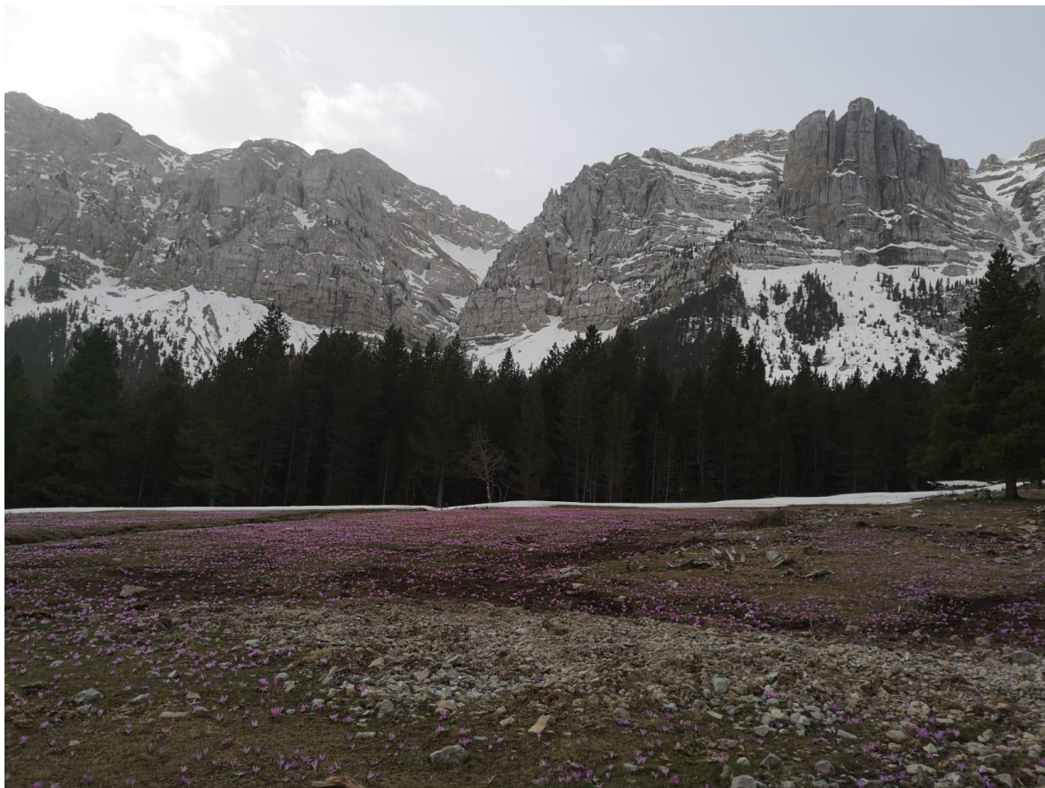
Condicions primaverals al Vessant Nord del Cadí, el dia 8, amb mantell discontinu a partir dels 1.800 m. A les Canals encara es manté la neu, endurida internament, però humida a les capes més superficials.