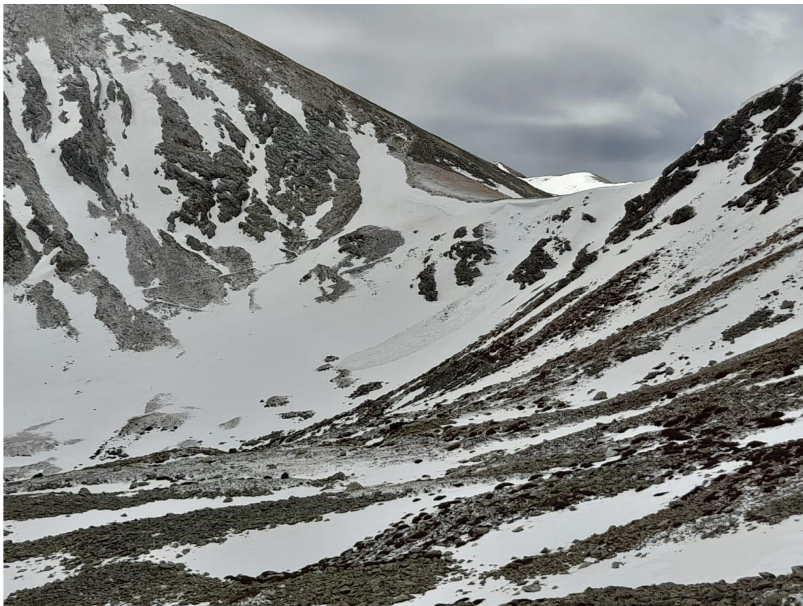
Allau de placa desencadenat després de la caiguda d'una cornisa, al coll de la Marrana, el dia 9 d'abril.