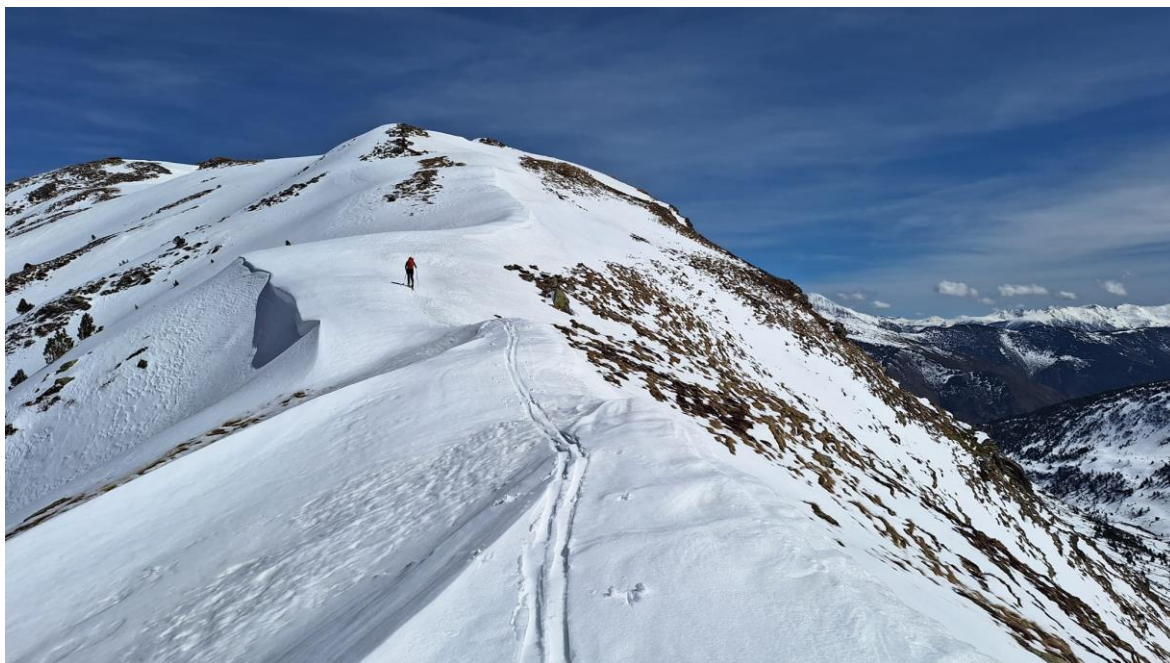
Esquiador de muntanya carenant a Tavascan (Franja Nord de la Pallaresa), el dia 4 d'abril. El fort vent de dies enrere va generar algunes cornises, a sotavent.