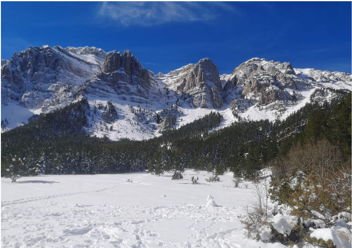
Neu recent el dia 2 d'abril, des del Prat de Cadí, amb la canal del Cristall i de l'Ordiguer de fons (Vessant Nord del Cadí-Moixeró).