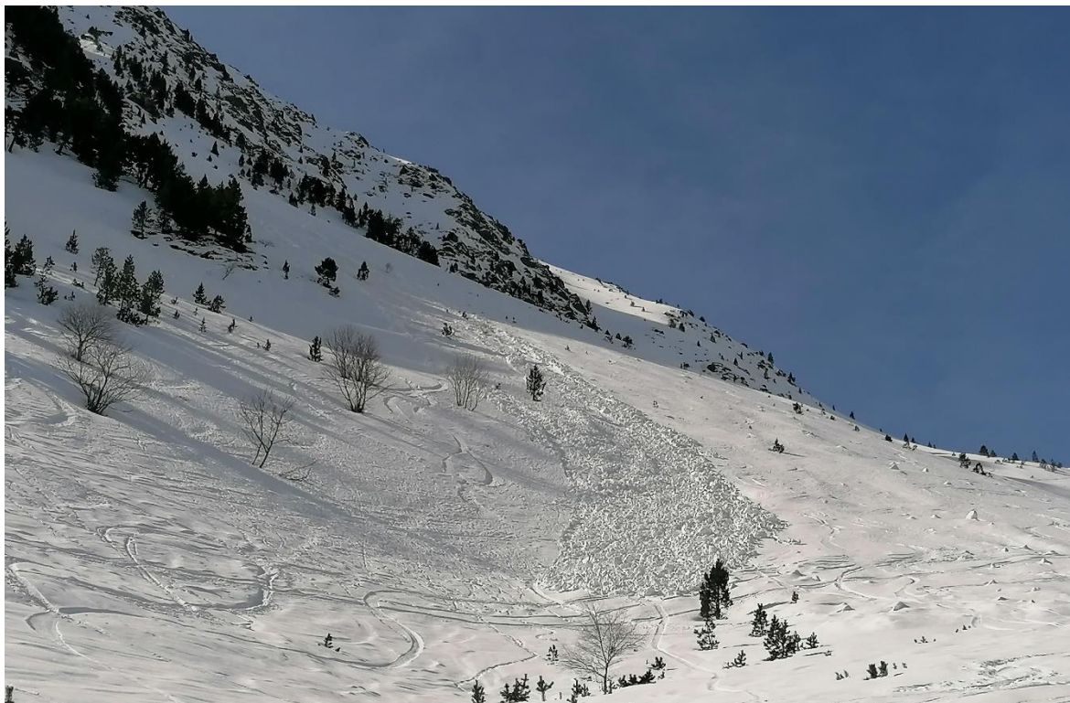
Allau de neu humida desencadenada de forma natural el dia 4 d'abril, a les Pales Sirgues, a Tavascan (Franja Nord de la Pallaresa).