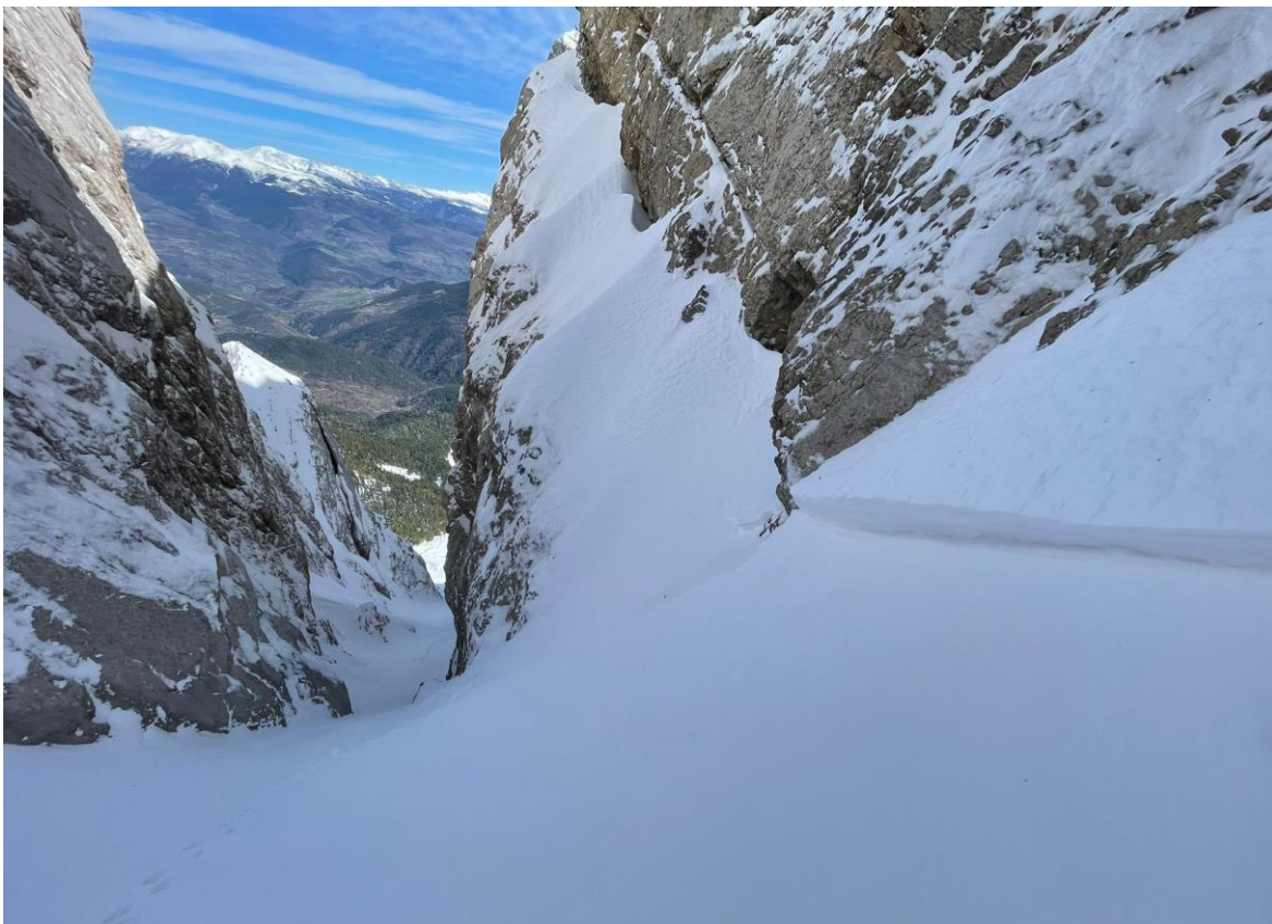
Cicatriu d'una placa de neu recent a la canal de l'Ordiguer (Vessant Nord del Cadí-Moixeró), observada el dia 2 d'abril.