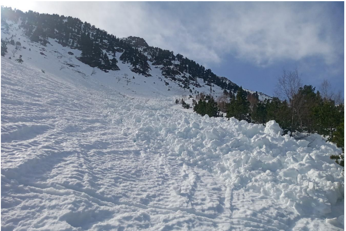
Allau de neu humida, natural, de sortida puntual, amb un gran dipòsit de boles, a Tavascan (Franja Nord de la Pallaresa), caigut entre la nit del dia 20 i la matinada del 21 de març.