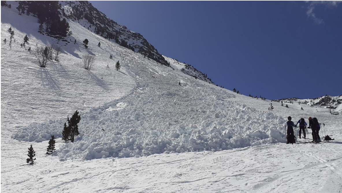
Allau natural de neu humida, de sortida puntual, caigut a Tavascan (Franja Nord de la Pallaresa), entre els dies 18 i el 19 de març. El dipòsit està format per grans boles que poden arribar a enterrar diverses persones. L'allau és d'entre mida 2 (mitjana) i 3 (gran).