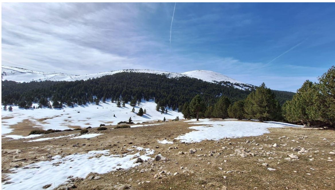
El mantell ha anat desapareixent a les solanes de Tuixent, el dia 22. Mirant cap a la Tossa Pelada apareix un mantell més continu per damunt dels 2.100 m, a obagues.