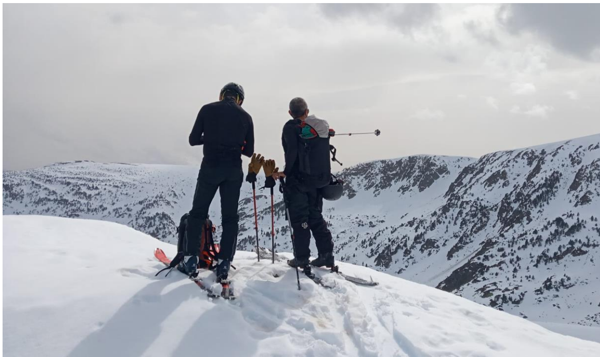
Paisatge des del coll de Trencacalders (Corbius), a Tavascan (Franja Nord de la Pallaresa), el dia 20 de març. El mantell és continu des dels 1.700 m a obagues.