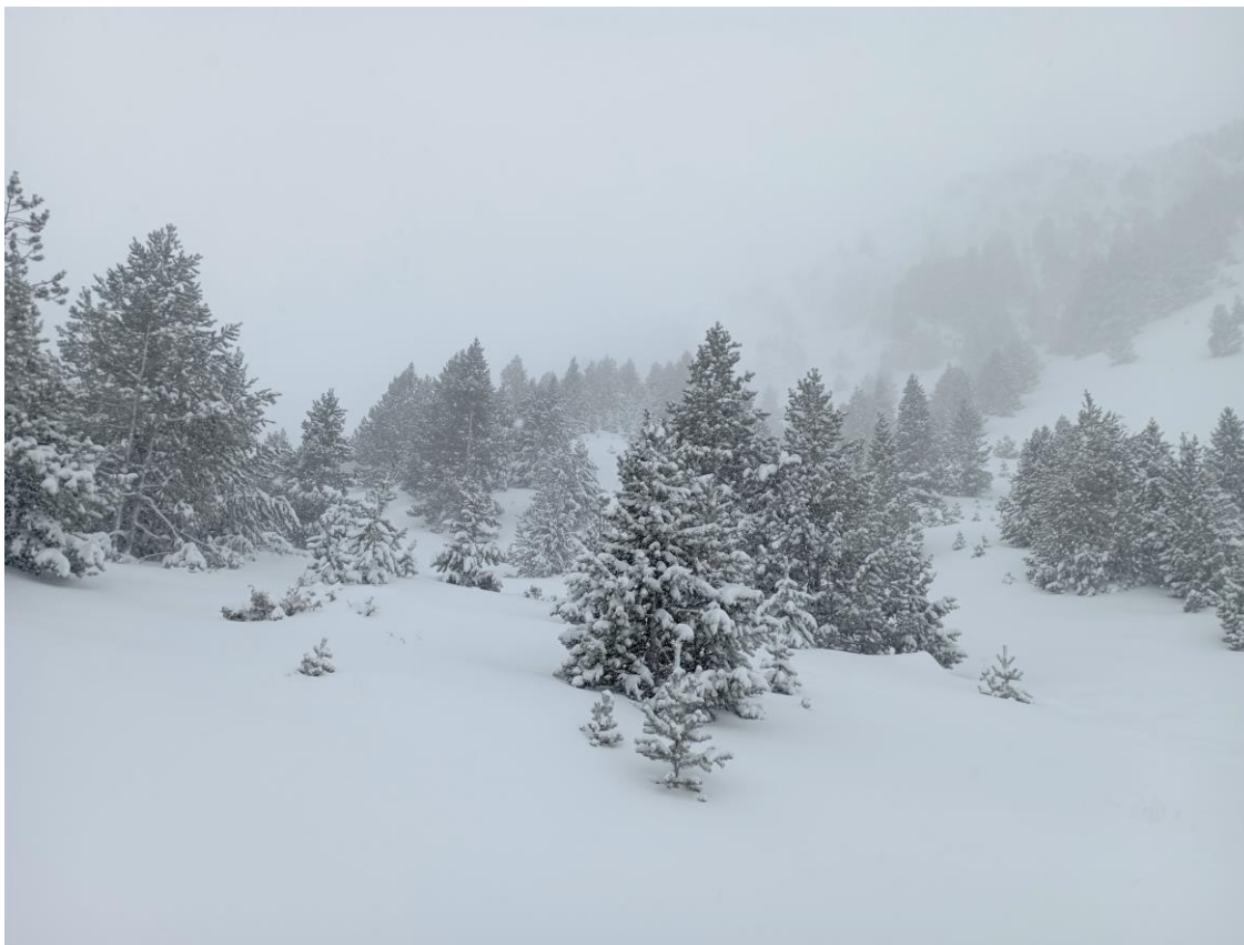
Neu recent als boscos de Coma Oriola, a la Masella (Moixeró), el dia 9 de març, després de la darrera nevada amb fort vent.