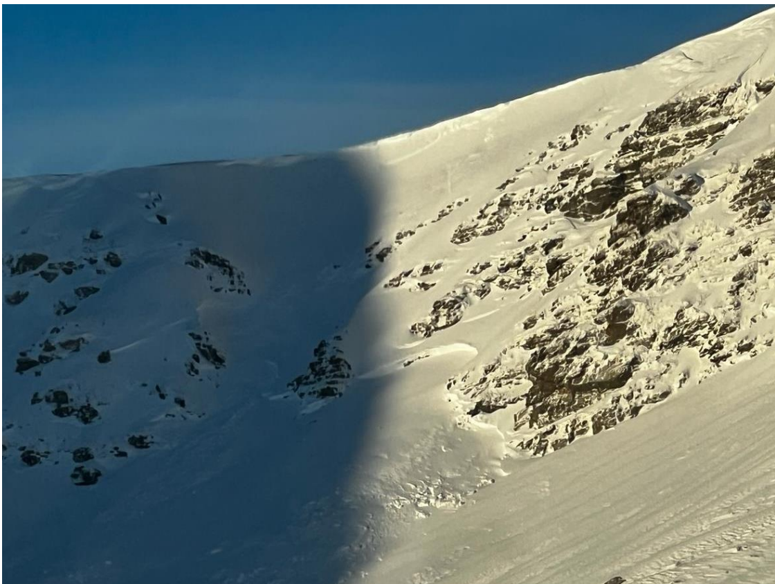
Allau de placa, desencadenada de forma natural durant el matí del 10 de març, prop del coll de la Marrana (Ter-Freser).