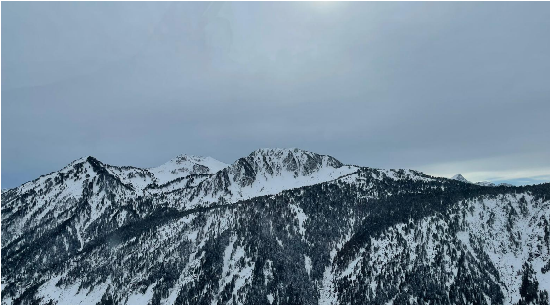
Paisatge recent nevat, el dia 4 a Beret (Aran), després de les nevades del cap de setmana.