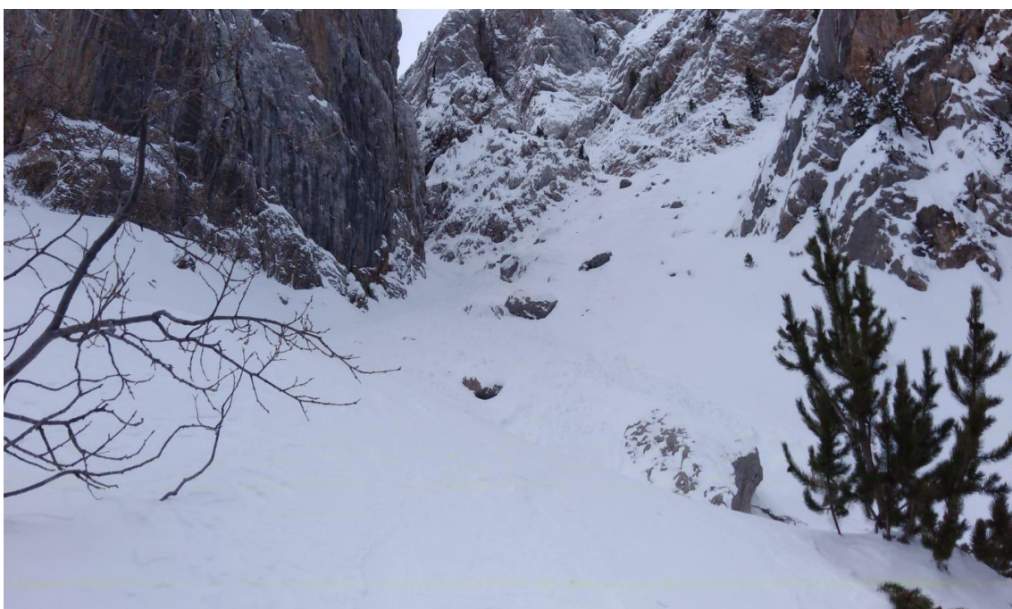
Allau de neu recent caiguda durant el cap de setmana del 9-10 de març a la canal de l'Ordiguier (Vessant Nord del Cadí-Moixeró). S'intueix un dipòsit, tot just al costat d'una gran roca.