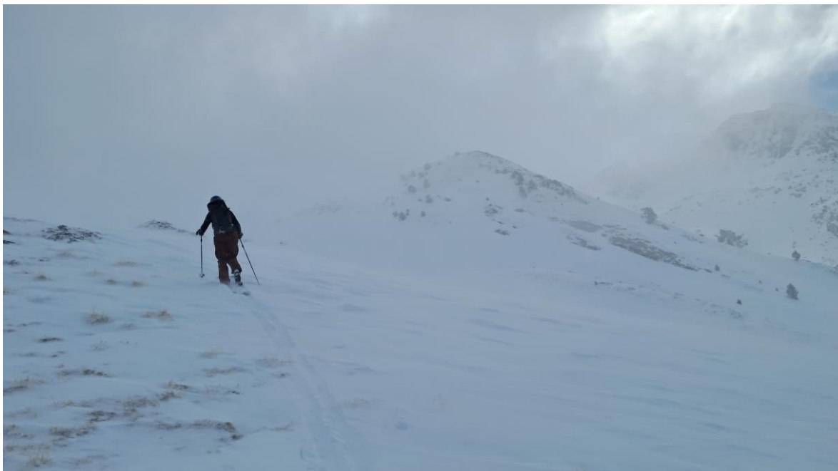
Esquiador de muntanya progressant per la Bonaigua (Franja Nord de la Pallaresa), el dia 28. En lloms i carenes es veu l'herba a causa del transport efectiu del fort vent del nord-oest.