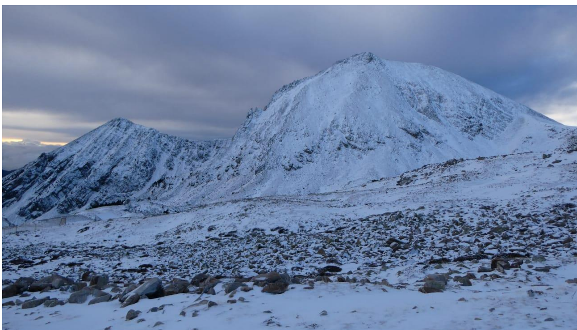
Gra de Fajol Petit i Gran, desde Vallter (Ter), el 24 de febrero. El manto es muy escaso y la nevada reciente ha enharinado un poco el sector.