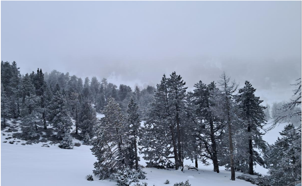
Bosque con nieve reciente en las ramas, desde Portainé, el 24 de febrero, justo después de la nevada.