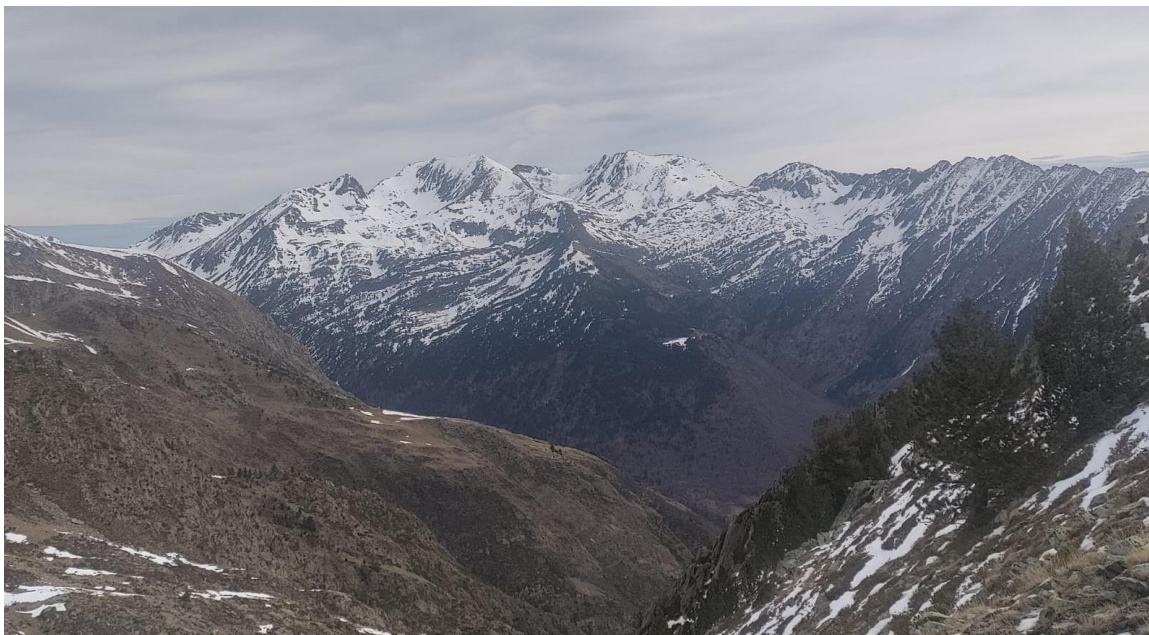
Desde Tavascan, mirando hacia el norte, en el valle de Noarre y el Pico de Certascan (Franja Norte de la Pallaresa), el día 22, aparecen las solanas sin nieve o muy discontinua por encima de los 2.300 m aproximadamente.