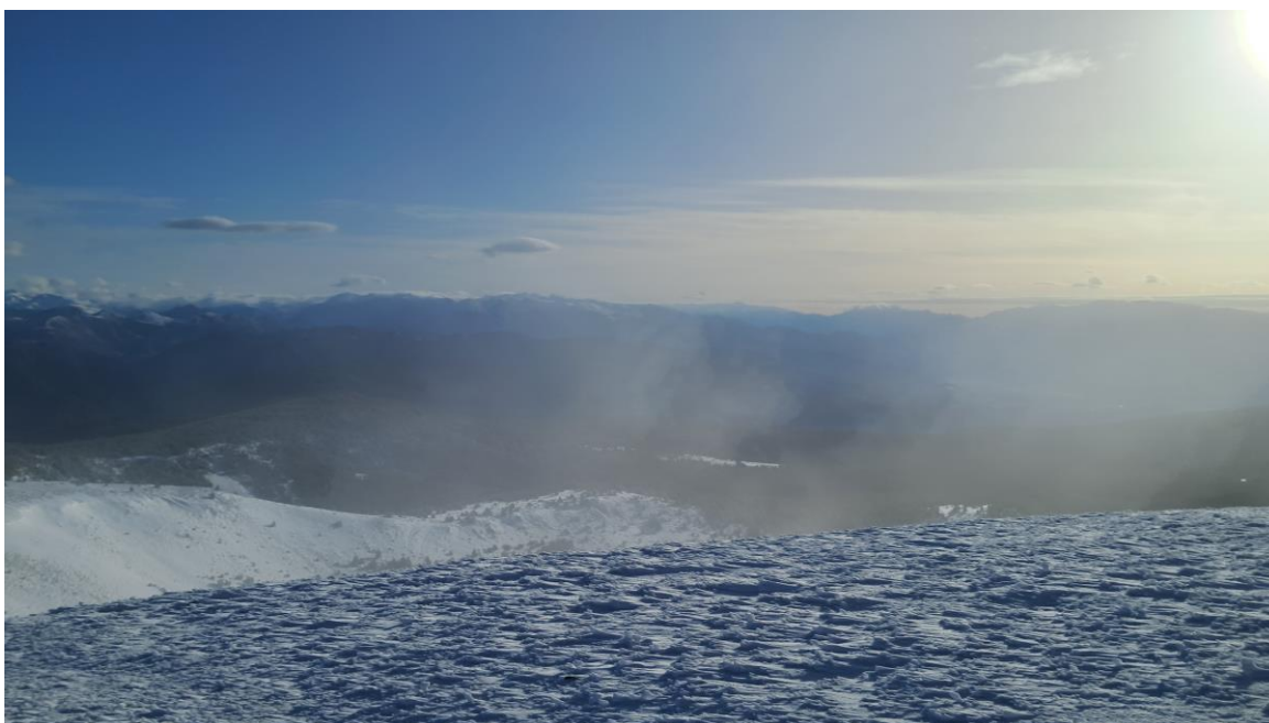
Des del Pic de l'Orri (Pallaresa), el dia 17, apareix un mantell ventat, després dels 15 cm caiguts a tot el sectors, distribuïts irregularment pel vent, sobretot a cims i carenes elevades.