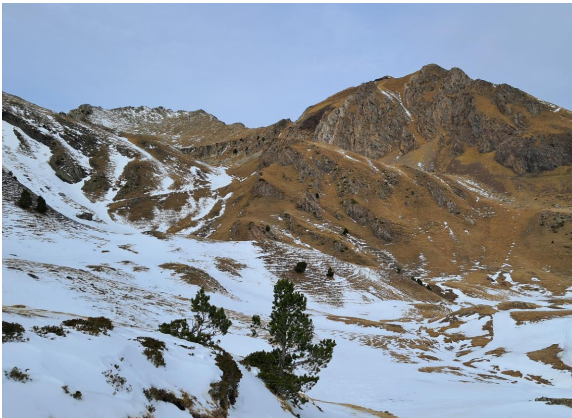
Bony de les Picardes (Pallaresa), el dia 15. A les solanes el mantell ha desaparegut i a les obagues trobem una mica de continuïtat, però amb poc gruix i moltes irregularitats.