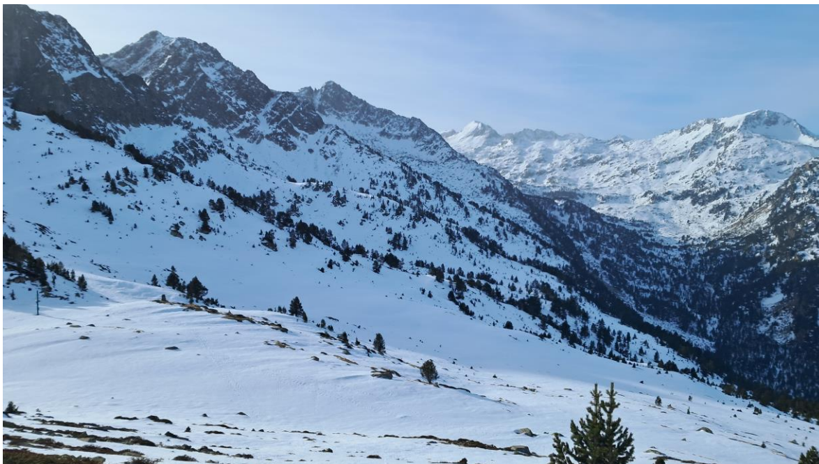
Mantell uniforme però escàs a la Bonaigua (Franja Nord de la Pallaresa), el dia 1 de febrer.