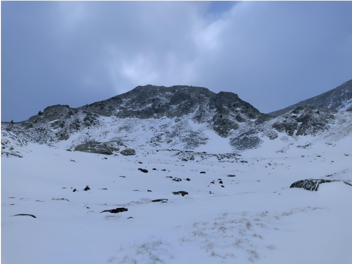
Al torrent de Margarida, a Tavascan (Franja Nord de la Pallaresa), el dia 21, trobem neu recent, una mica humida, amb un mantell, en general, escàs i amb deflacions a moltes orientacions, a cota alta.