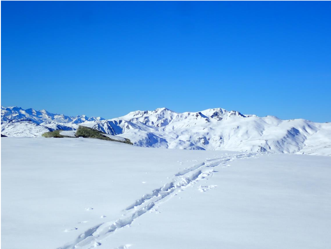
Mantell continu i regular a cotes altes de Beret (Aran), el dia 18, tot i que amb poc gruix, en general.