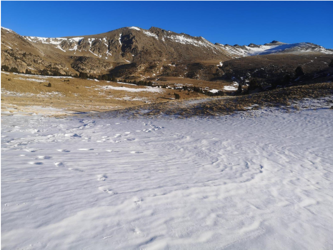
Solanes sense presència de neu o amb algunes congestes i obagues amb mantell escàs, al sector del Perafita, el 27 de desembre.