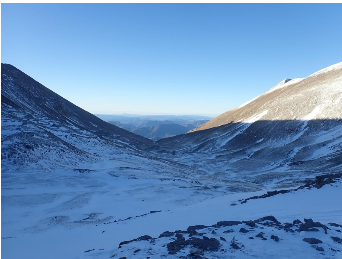
Terreny enfarinat i amb la neu distribuïda irregularment a causa del fort vent a Boí (Ribagoçana-Vall Fosca), el 16 de desembre. El gruix és molt escàs a totes les orientacions.