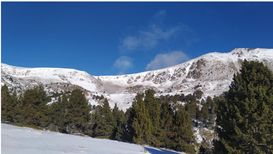
Mantell escàs i amb una enfarinada recent camí del Coll de la Barra (Perafita-Puigpedrós), el dia 15 de desembre de 2023.