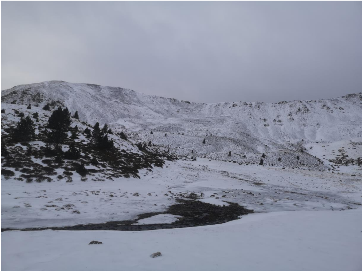
Mantell escàs i amb una enfarinada recent camí del Monturull (Perafita-Puigpedrós), el dia 9 de desembre de 2023.