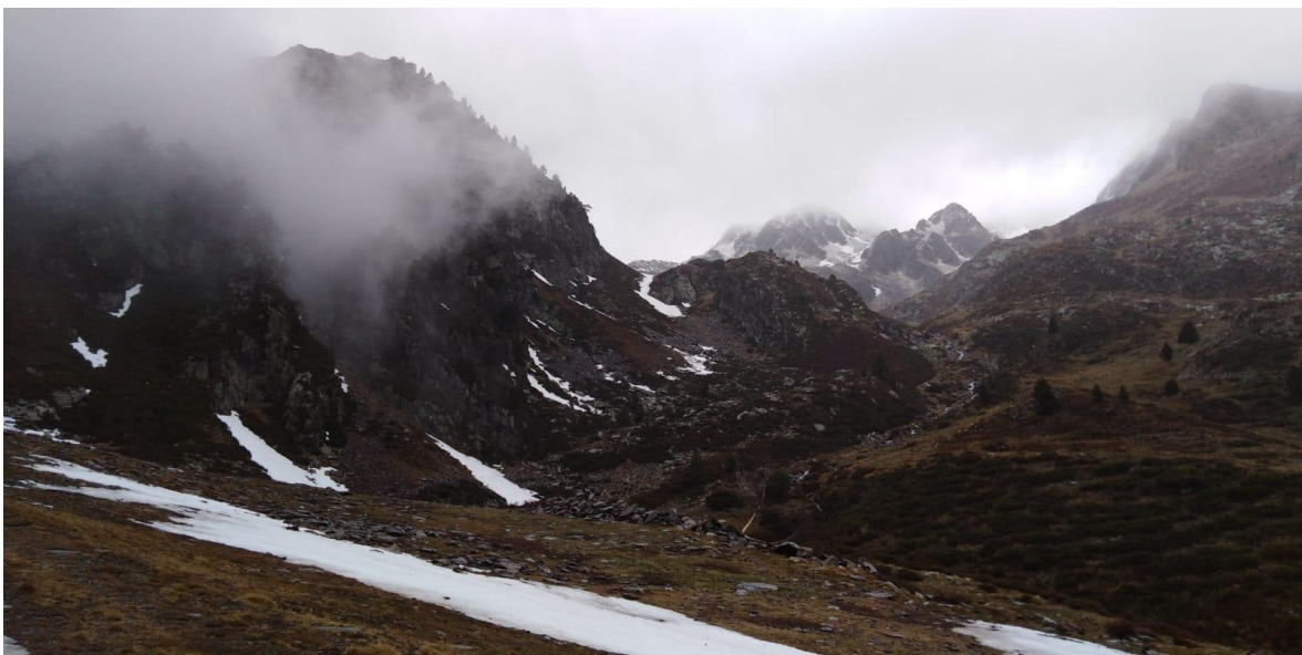
Núvols retinguts després d'haver precipitat a Tavascan (Franja Nord de la Pallaresa), el 22 d'abril. La neu granulada i la calamarsa apareixen a partir d'uns 2.300 m d'altura.