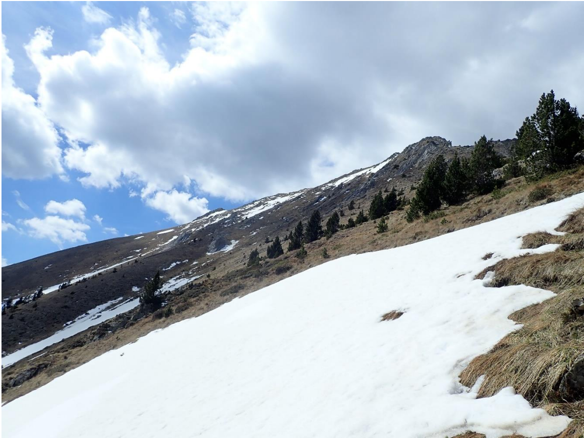
Congestes i mantell molt discontinu al Teso de Son (Pallaresa), el 21 d'abril. Al lloc d'observació trobem 52 cm de neu vella, amb crostes dures i gra de fusió. El mantell només és esquiable en conques i tubs a obagues.