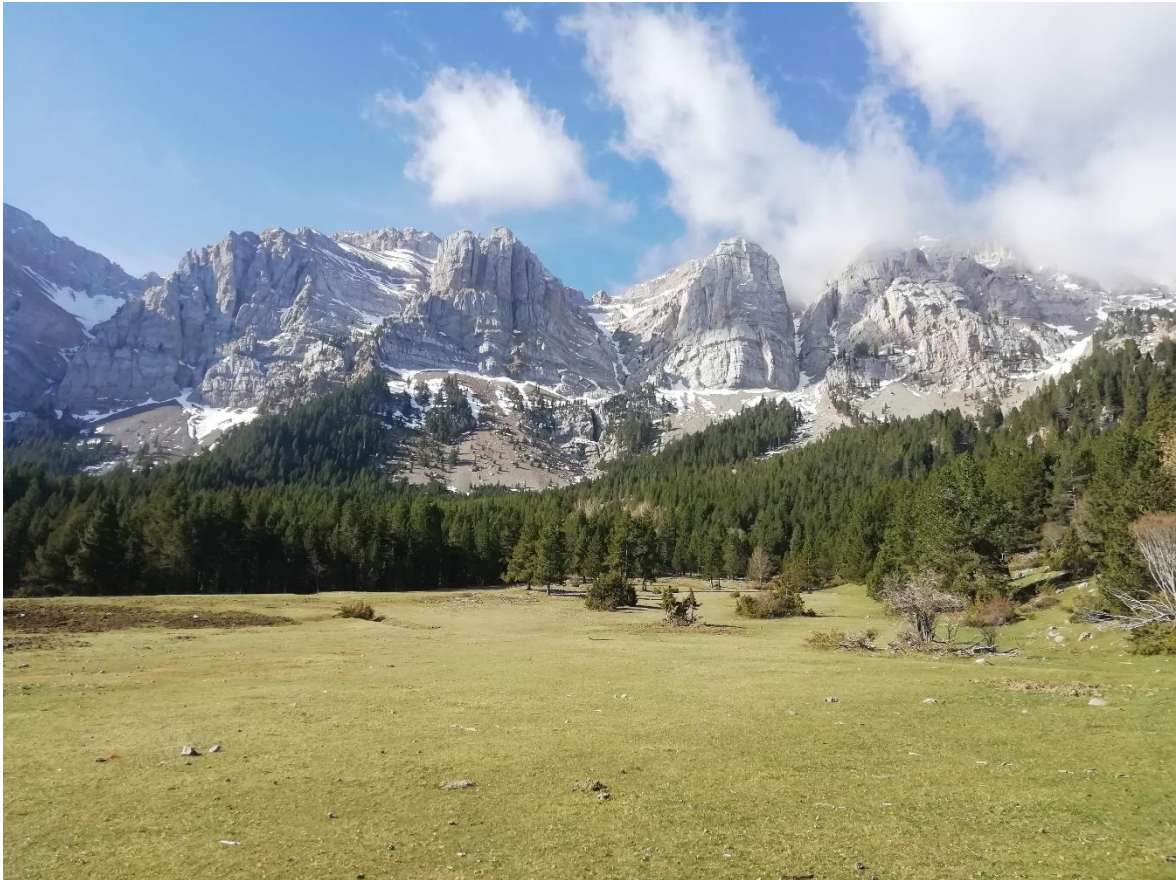
Vessant Nord del Cadí, el dia 19 d'abril, amb un mantell escàs i restringit a les Canals. A la resta, el mantell ha desaparegut o només apareixen algunes congestes