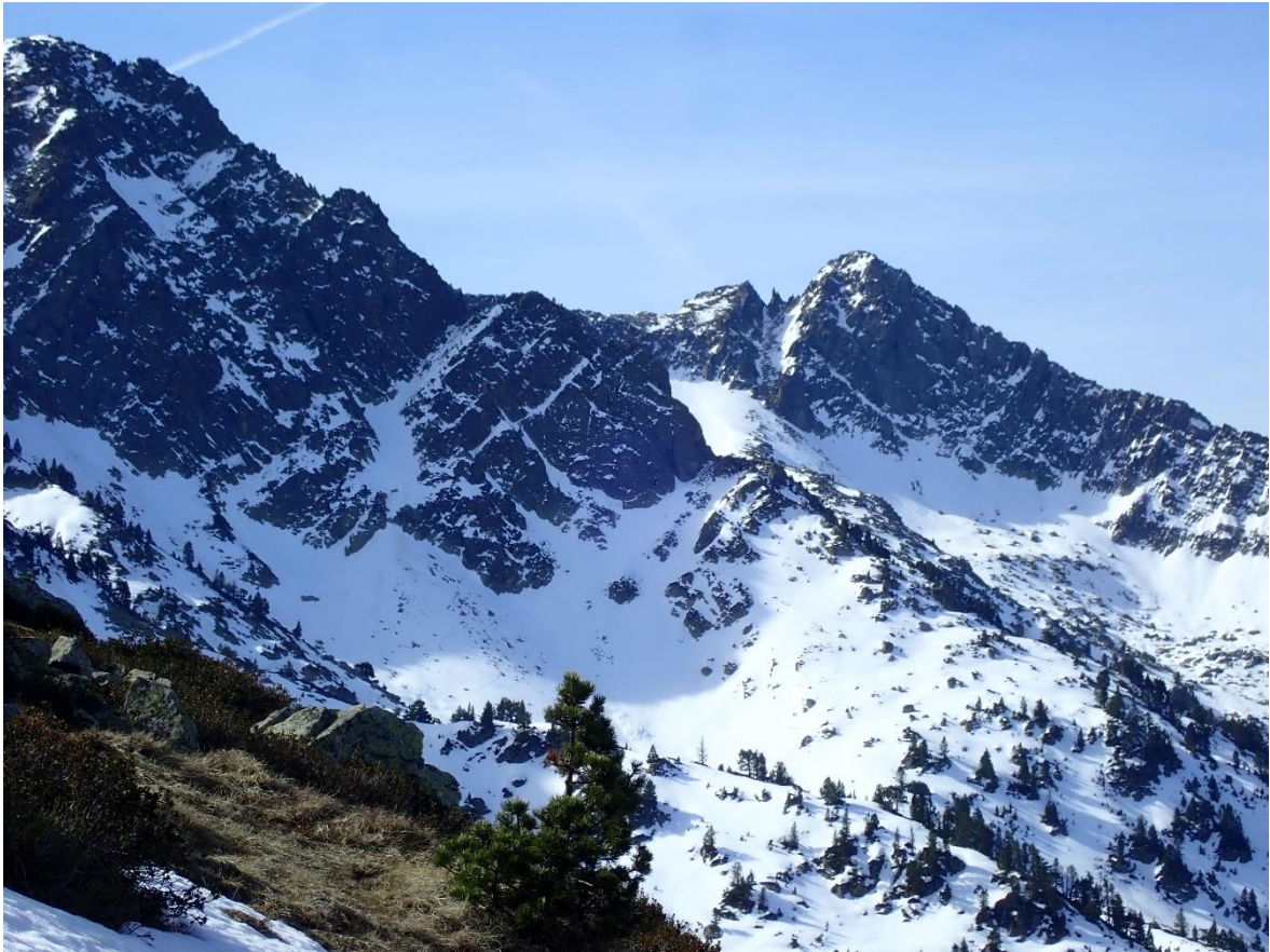
Manto uniforme, el martes 11, en las umbrías de la Bonaigua y en las montañas de la Franja Nord de la Pallaresa, mientras que en solanas el manto es más escaso y con discontinuidades importantes.