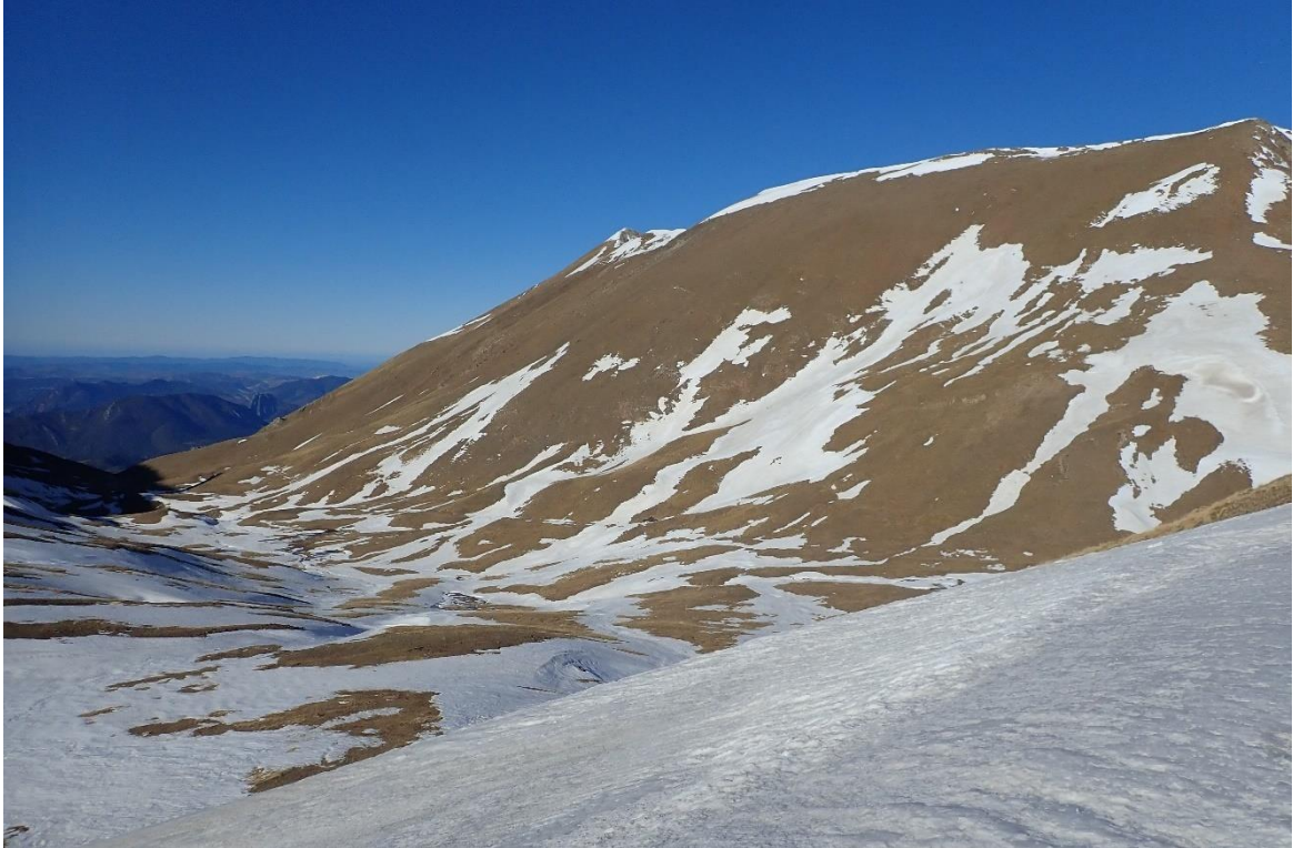
Mantell endurit, escàs i amb grans discontinuïtats al Port d'Erta (Ribagorçana-Vall Fosca), el dia 4 d'abril. Les solanes estan, pràcticament, desproveïdes de neu.