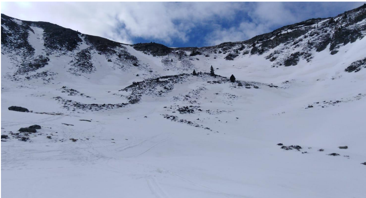
Mantell uniforme, tot i que afloren roques, amb neu més seca a partir dels 2.100 m a Tavascan (Franja Nord de la Pallaresa), el 6 d'abril. Trobem més continuïtat en fondos, tubs i canals.