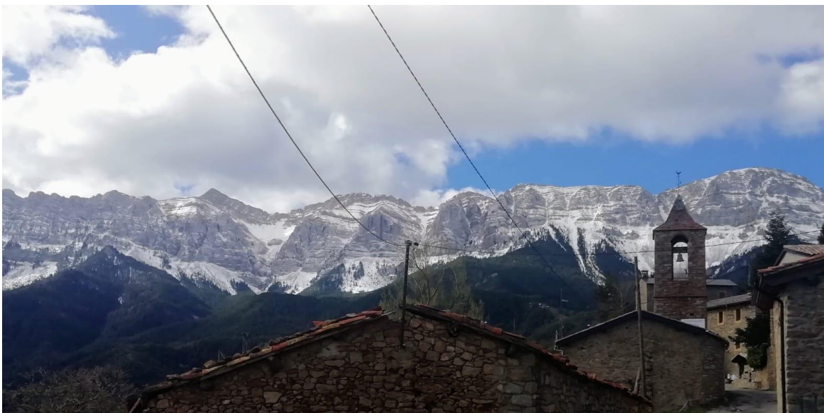
Enharinada en el Vessant Nord del Cadí, el domingo 2 de abril. Pese a los chubascos, el manto sigue siendo discontinuo y muy escaso.