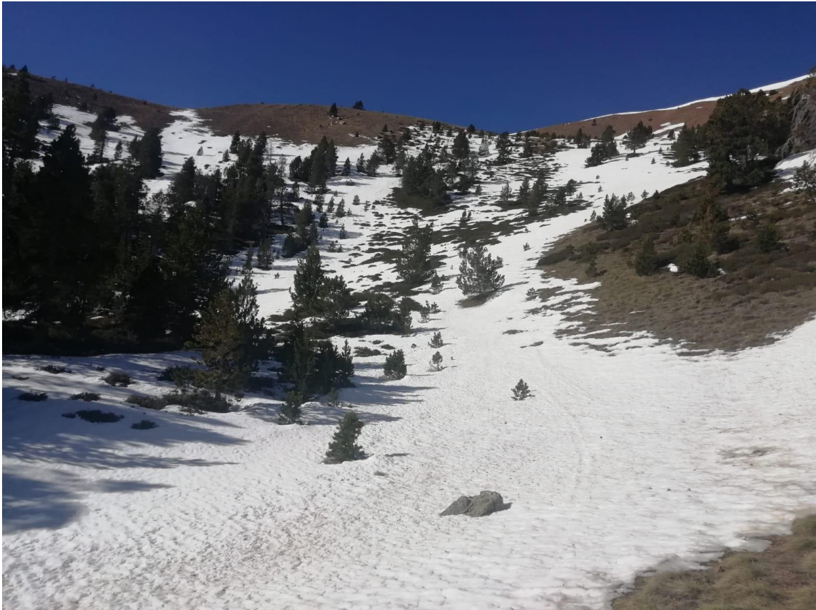
Mantell encrostat, escàs i discontinu al coll de la Barra (Perafita-Puigpedrós), el 30 de març.