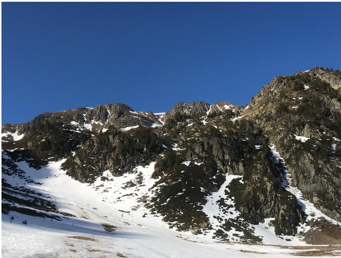
Mantell endurit, escàs i amb discontinuïtats a les solanes de Tavascan (Franja Nord de la Pallaresa), el dia 31 de març.