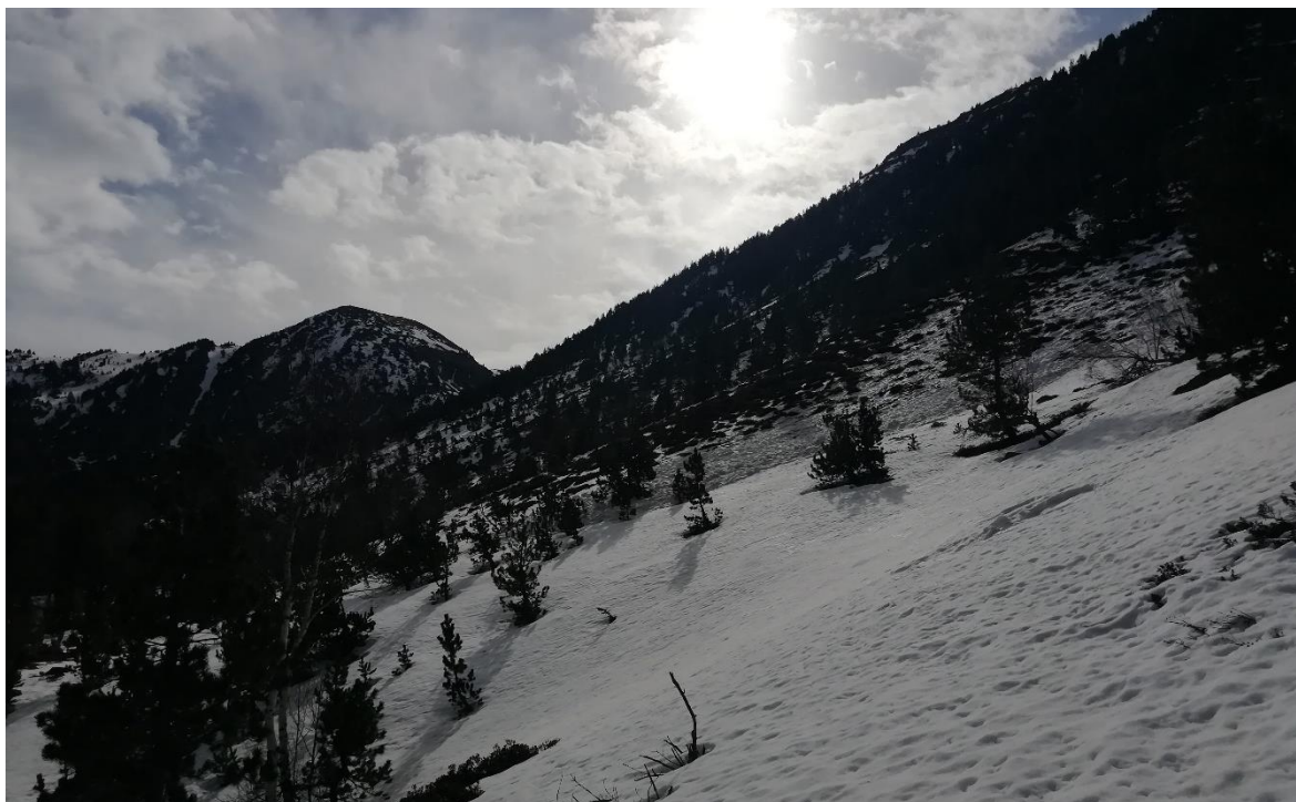
Mantell amb neu vella primavera, camí del Monteixo (Pallaresa), el dia 24, amb les restes d'un dipòsit d'una allau humida caiguda fa dies.