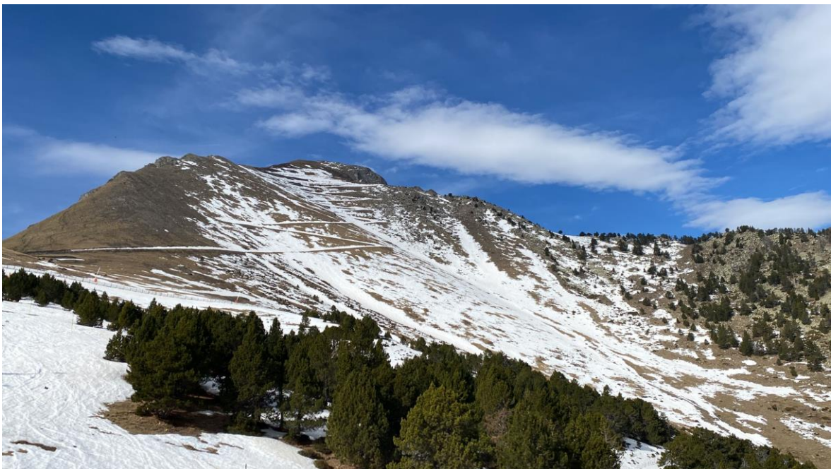
Mantell escàs i discontinu a la Pala d'Eixe (Pallaresa), el 23 de març. Les fortes ventades, la pluja i les altes temperatures d'aquestes darreres setmanes han fet retrocedir sensiblement el mantell en aquests vessants orientats a l'est.