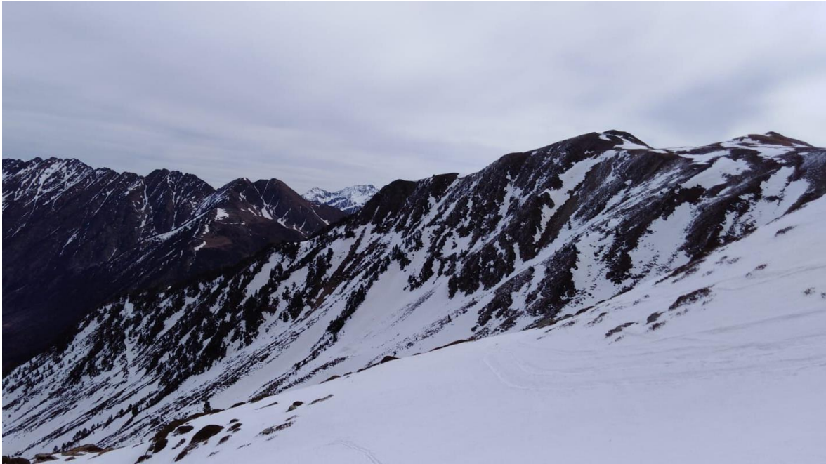
Mantell continu a les obagues del Torrent de Mascarida, a Tavascan (Franja Nord de la Pallaresa), el dia 21 de març.