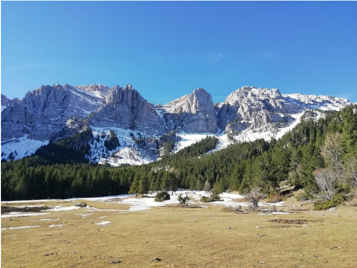
Mantell escàs i discontinu a Prat de Cadí, el dia 17, amb la Roca de l'Ordiguer en primer terme. Els gruixos estan per sota de l'habitual en aquestes dates.