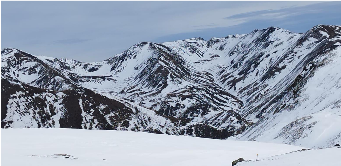
Vall de Noucreus i Noufonts (Freser), el dimecres 8 de març. Pel que fa al mantell, apareixen moltes discontinuïtats, deflaccions i zones desprovistes de neu, sobretot a solanes. (Imatge: CAR).