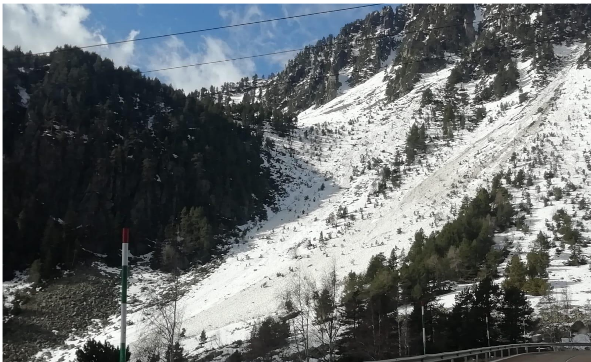
Allau de neu humida a la Mare de Déu, Franja Nord de la Pallaresa. Tot i que la imatge és de dilluns 13 de març, les allaus corresponen a l'interval entre el 9 i el 12.