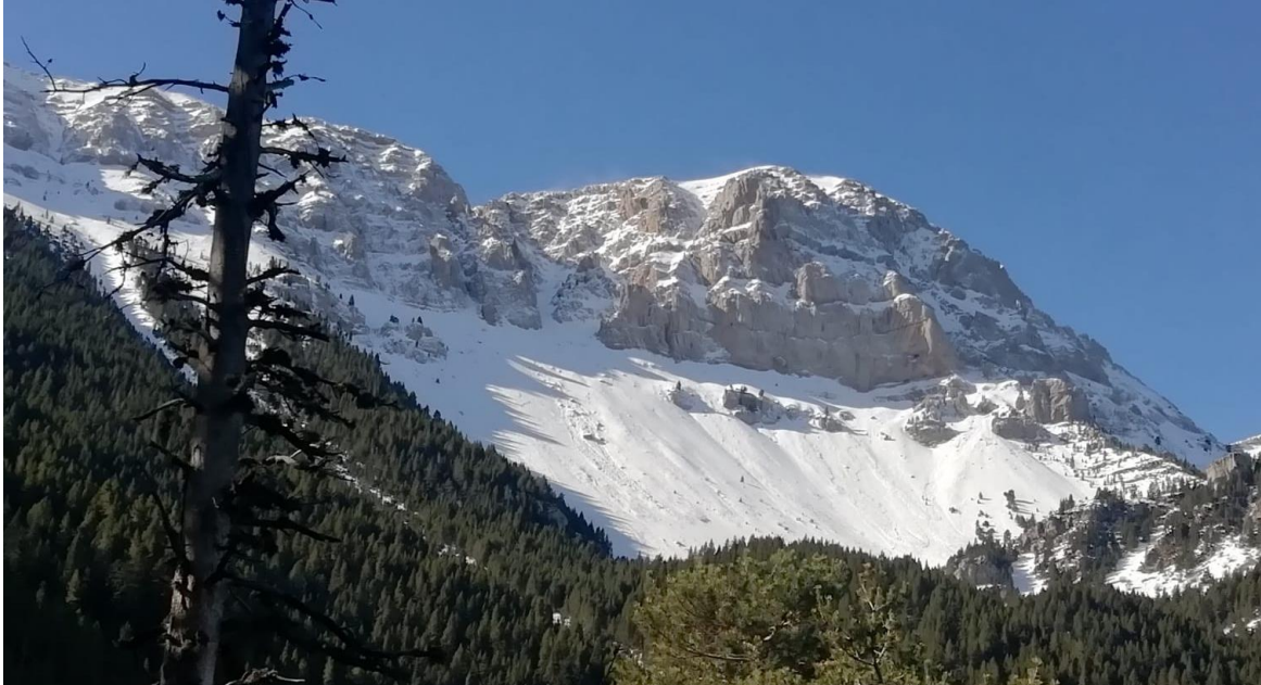
Vessant Nord del Cadí, amb una allau de neu humida de mida 1, observada el dia 10 de març.