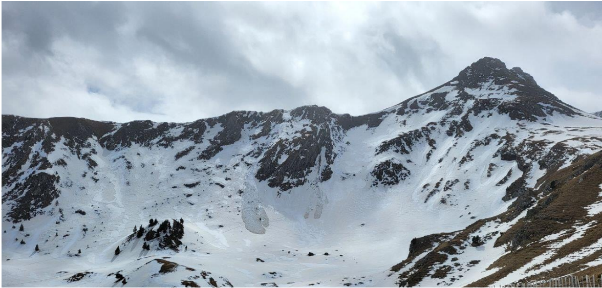
Allaus de neu humida caigudes el dissabte 11 al vessant nord-est del Bony de les Picardes (Pallaresa).