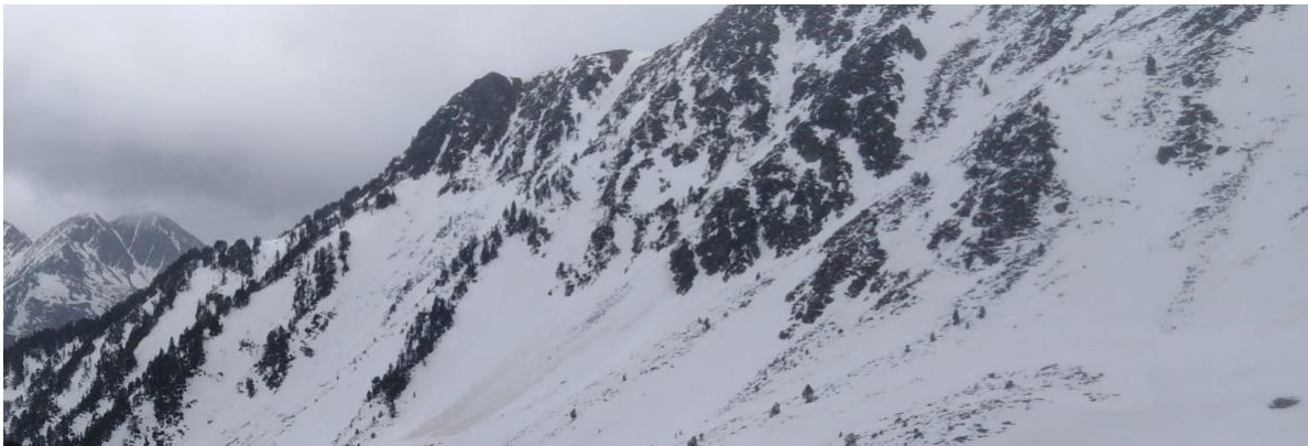
Panoràmica a Pales Sirgues, Franja Nord de la Pallaresa, de dissabte 11 de març. A aquest sector s'hi van registrar algunes allaus de mida D2. Les pluges no van ser l'únic element que va donar lloc a humitejament, també hi va contribuir el contacte entre els núvols densos amb temperatures positives i la neu.