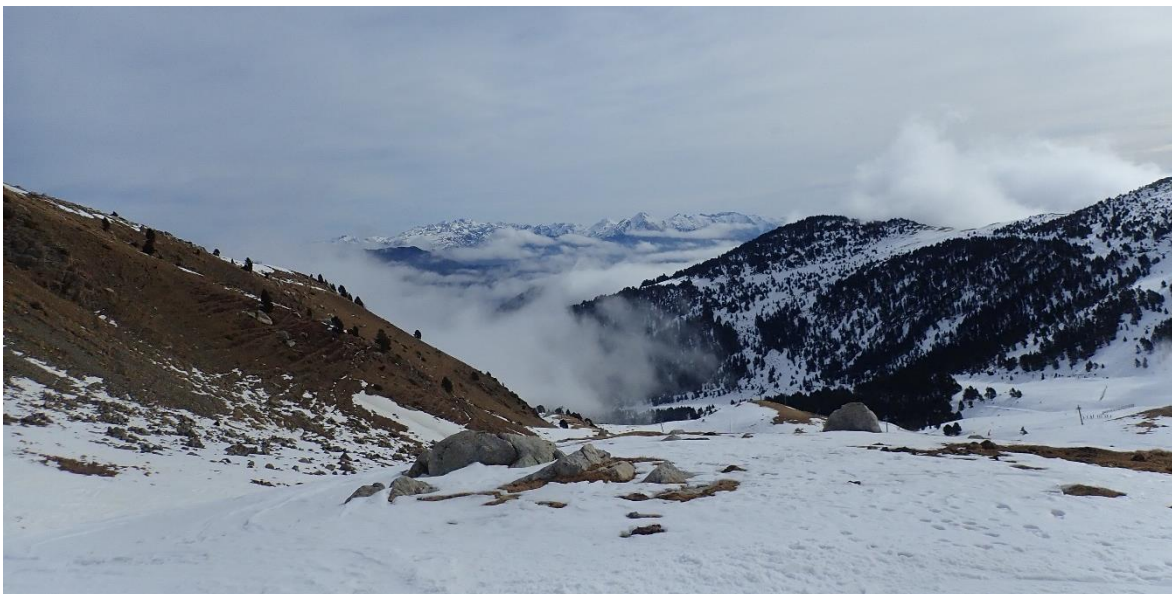
Barranc dels Estanyets (Pallaresa) el 8 de març. S'aprecia un mantell continu a les orientacions obagues, i escàs o inexistent a les assolades. A les cotes més baixes algunes boirines ja feien que el patró de neu humida anés guanyant pes.