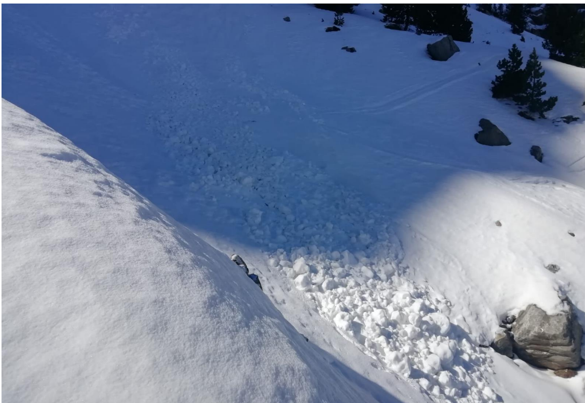
Allau de neu humida de mida petita, camí de la canal de l'Ordiguer (Vessant Nord del Cadí-Moixeró), observada el divendres, dia 10. L'allau va caure entre dimecres 8 i dijous 9.