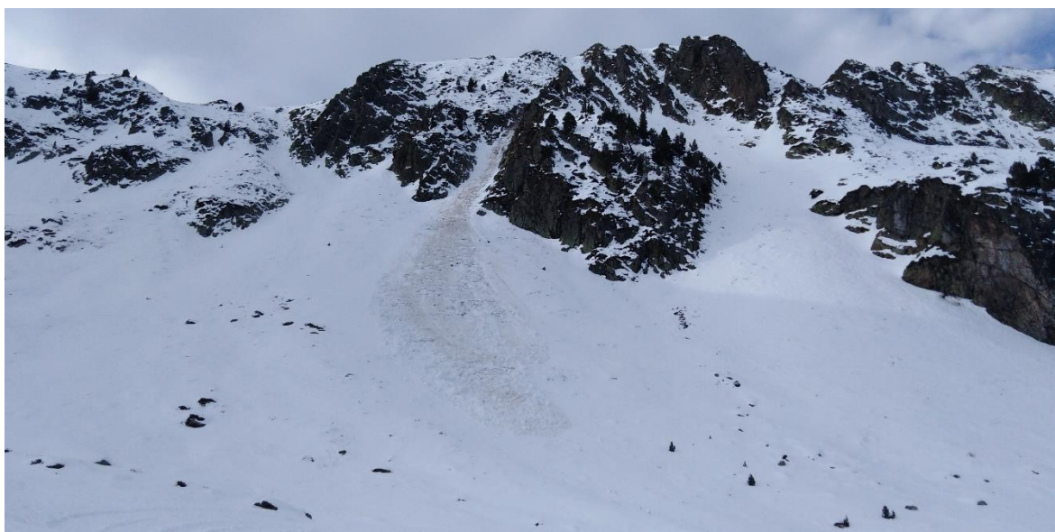
Lliscament basal observat dissabte, dia 31, a Tavascan (Franja Nord de la Pallaresa). L'ambient suau, les temperatures positives i els plugims fins a cota alta han estat els factors de l'humitejament del mantell, fins a la seva base, en alguns vessants, amb l'activació dels lliscaments a solanes inclinades i herboses.