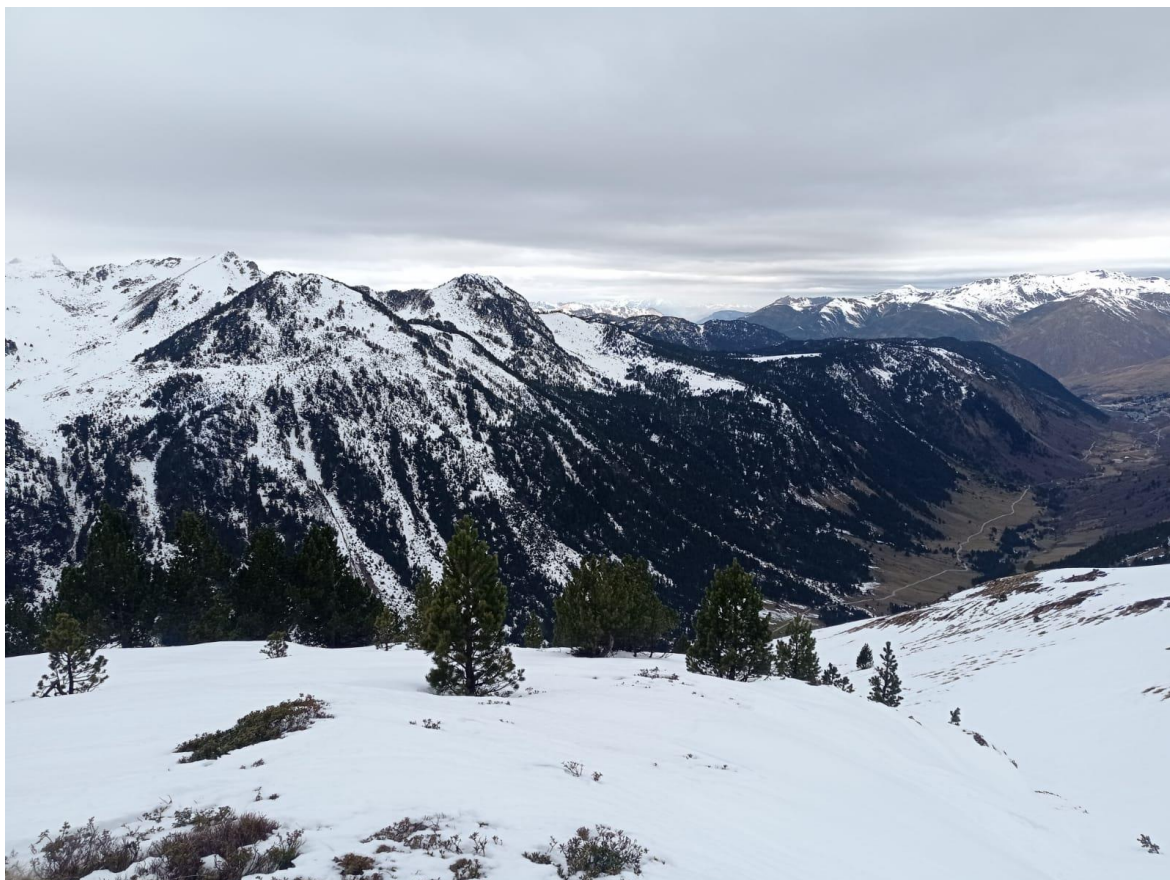
Panoràmica des de la Bonaigua (Aran), amb un mantell escàs i humitejat pel pas d'un front càlid, el dia 30, que va deixar plugims fins a cota alta. Les valls apareixen desprovistes de neu i a cota alta els gruixos són escassos arreu.