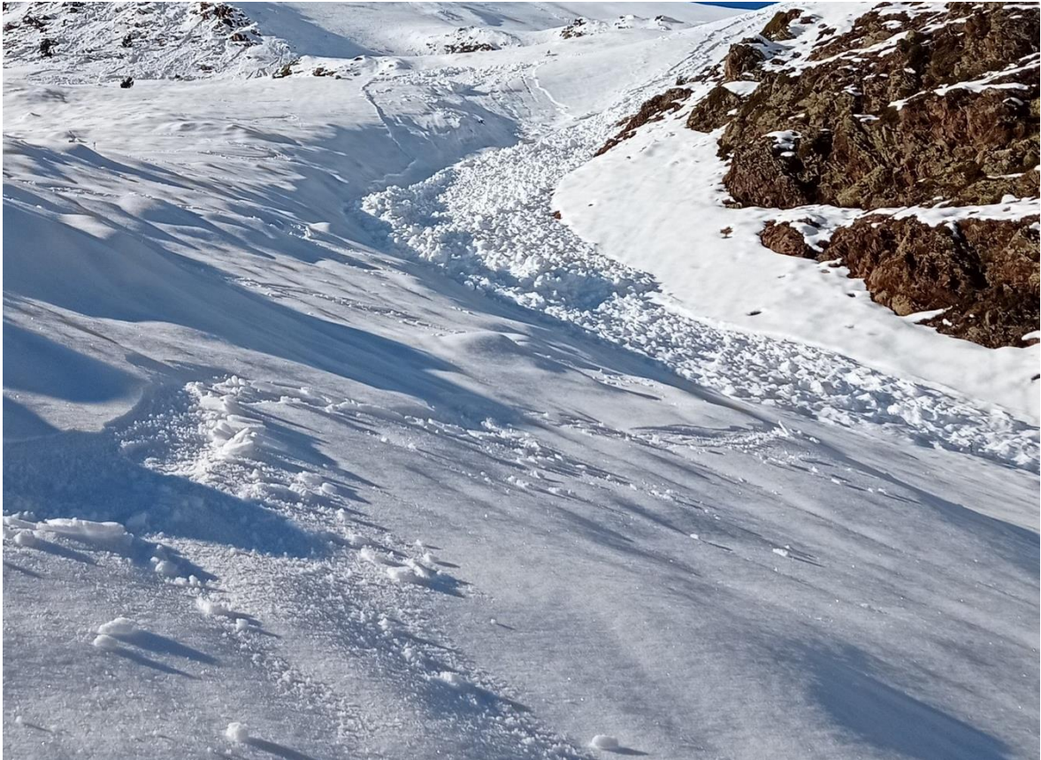
Allaus de neu recent humida a la Vall de Riquèrna, a la Ribagorçana-Vall Fosca. La imatge correspon a diumenge, però les allaus van caure probablement dijous dia 15 de desembre.