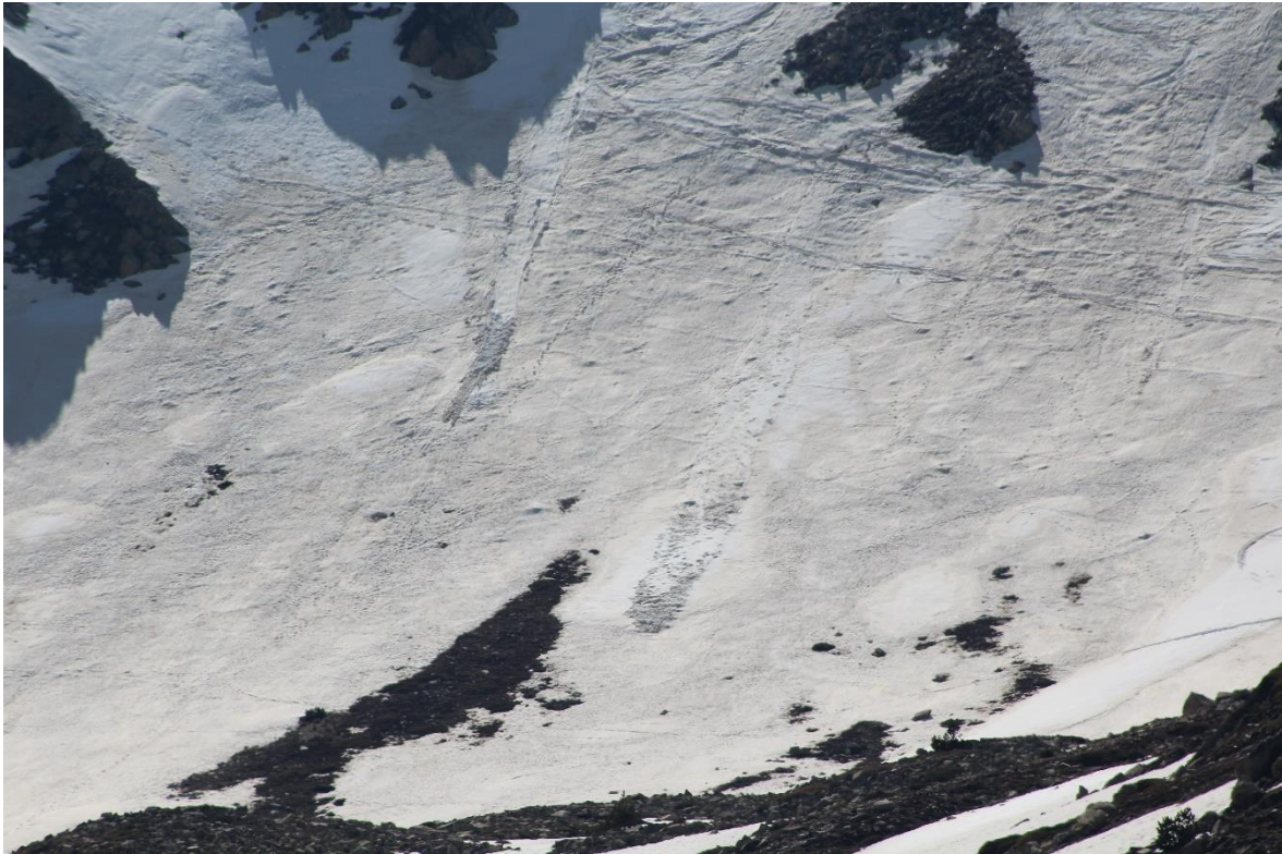
Petites purgues a les solanes de Vallter, observades en terreny dret i amb el seu origen prop de sectors rocosos, del 12 de maig.