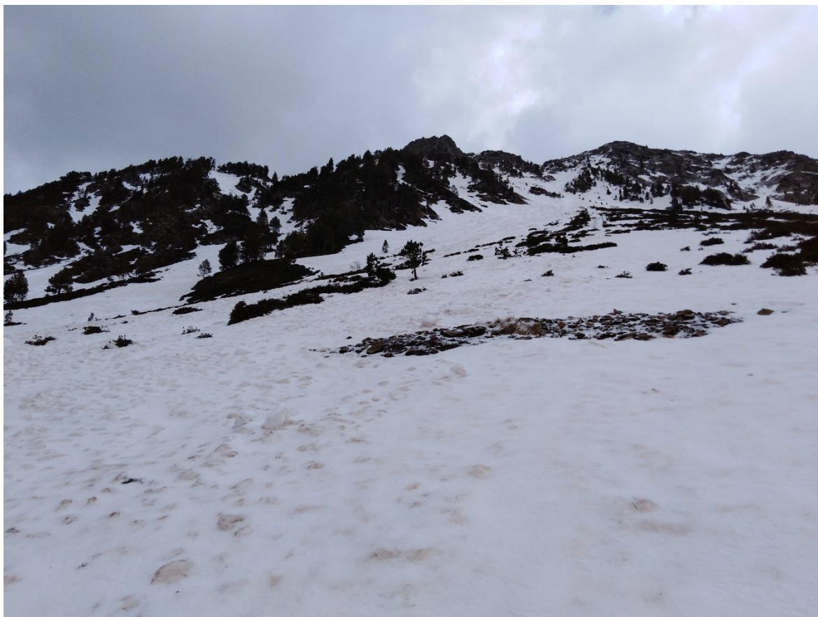
Restes d'una allau humida, amb grumolls i crostes marrons, a Tavascan (Franja Nord de la Pallaresa), el 6 de maig.