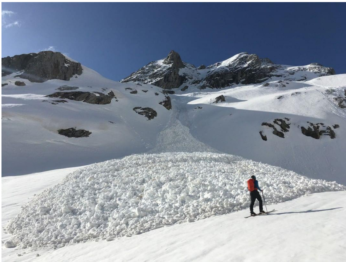
Camí del Còth d'Alfred, a l'Aran, del 29 d'abril, un esquiador de muntanya voreja el dipòsit d'una allau de neu humida de mida 2 (mitjana).