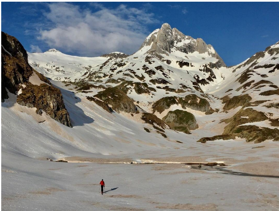
Camí del Còth d'Alfred, a l'Aran, del 29 d'abril, amb presència d'un mantell humit i amb purgues. La regressió del mantell fa aflorar les crostes marrons saharianes, especialment a les solanes.