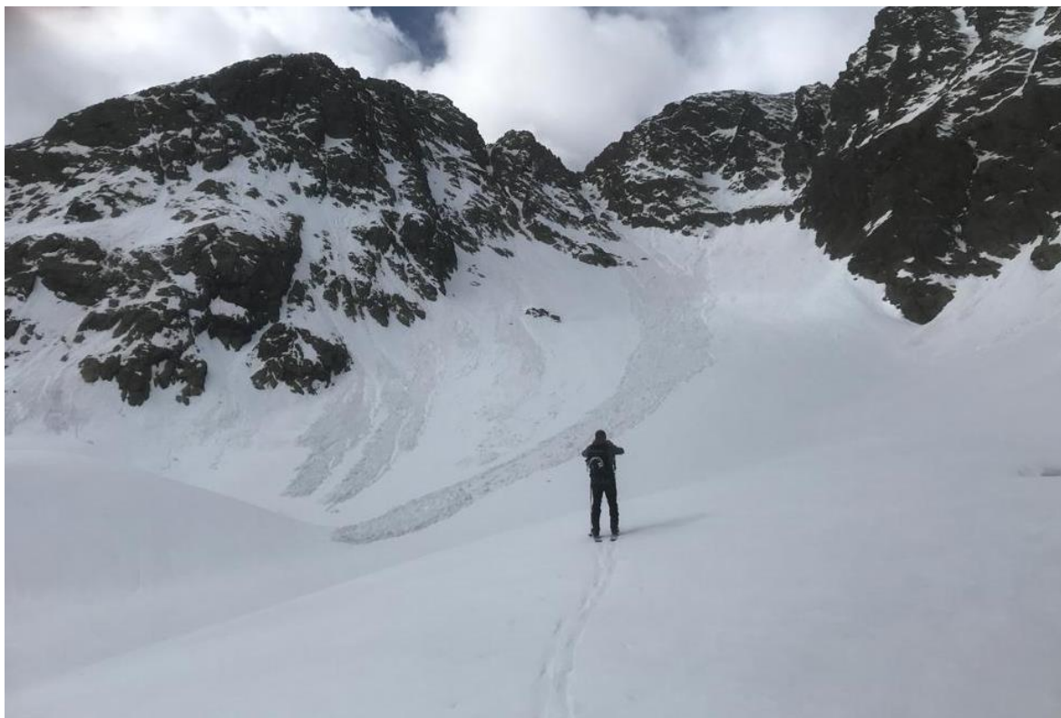
Purgues de neu humida caigudes a la zona del Monteixo (Pallaresa), el 30 d'abril. Les allaus són de sortida puntual i no superen la mida 1 (petita).