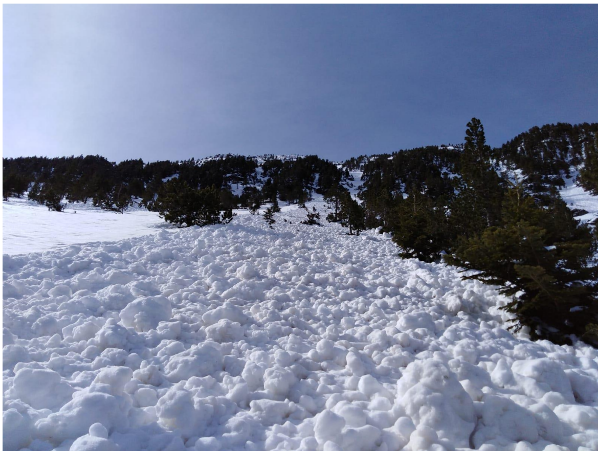
Depósito en grumos de una purga de nieve húmeda caída entre el 21 y el 22 de abril en el sector del Monteixo (Pallaresa).