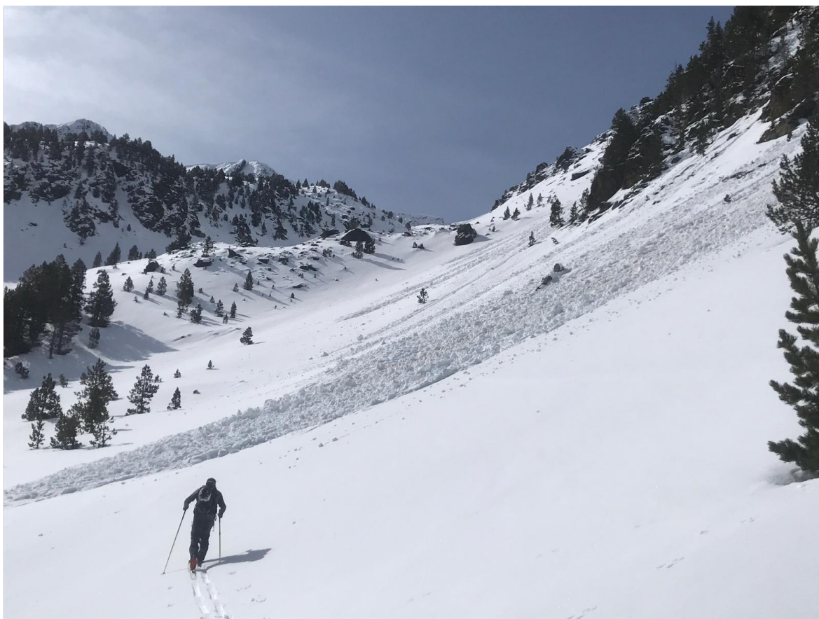
Imagen camino del Monteixo (Pallaresa) del 22 de abril. Se observa actividad de aludes de nieve húmeda, con varias purgas caídas posteriormente en la nevada que acumuló unos 15-20 cm en este sector.