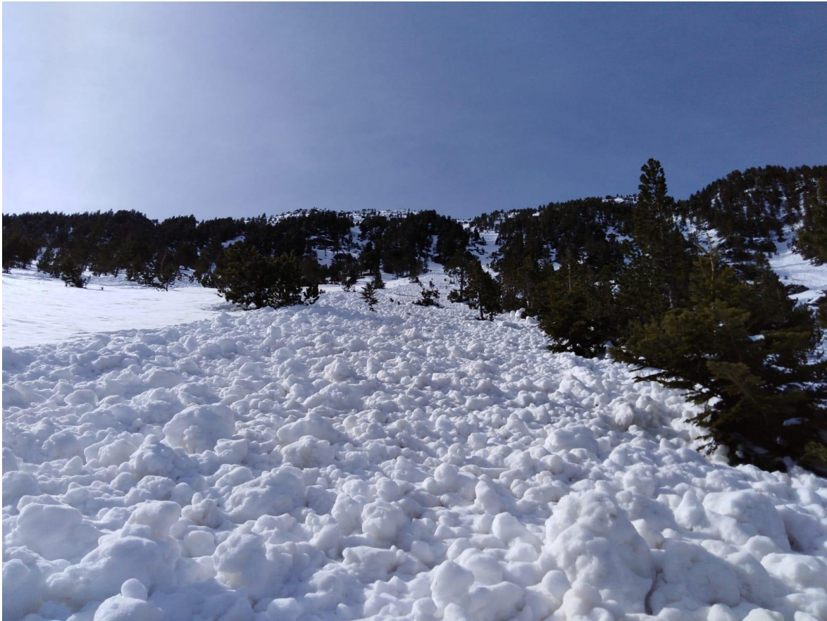
Dipòsit en grumolls d'una purga de neu humida caiguda entre el 21 i el 22 d'abril al sector del Monteixo (Pallaresa).