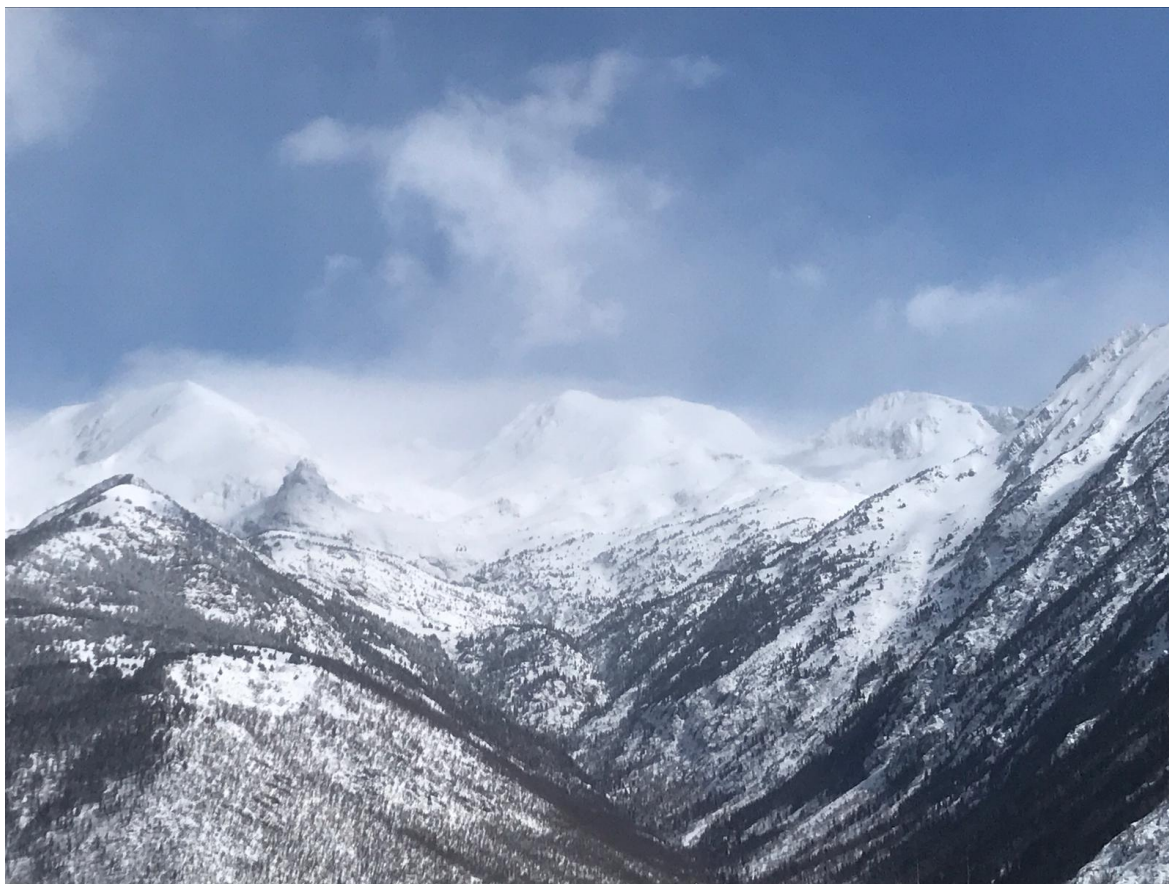
Manto uniforme con la nieve reciente de la última nevada hasta el fondo de valle, des de Tavascan, mirando hacia el valle de Noarre y Certascan, el domingo 3 de abril.