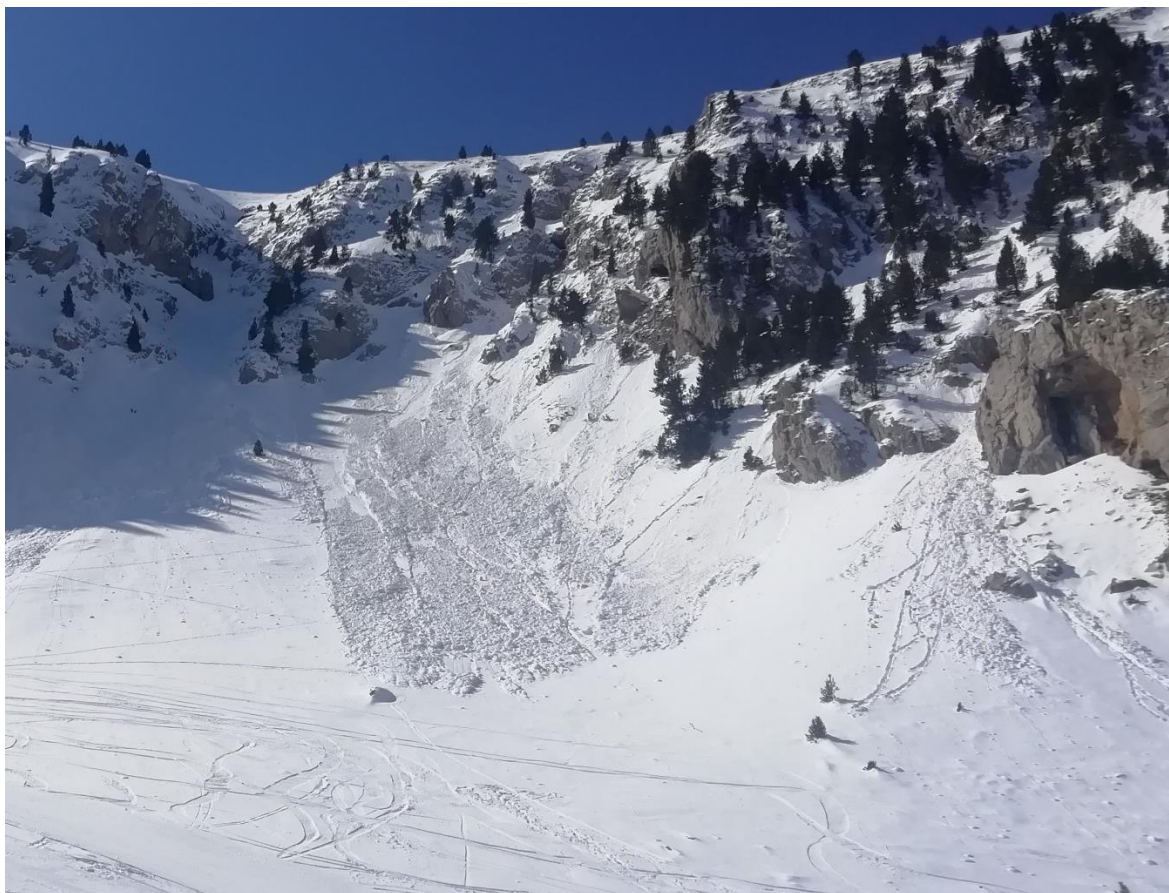
Purgas de nieve húmeda observadas el viernes 1 de abril, en la zona de Les Pedrusques (Moixeró), posteriores a la nevada de unos 15 cm, aproximadamente, acumulados entre el martes y el miércoles.