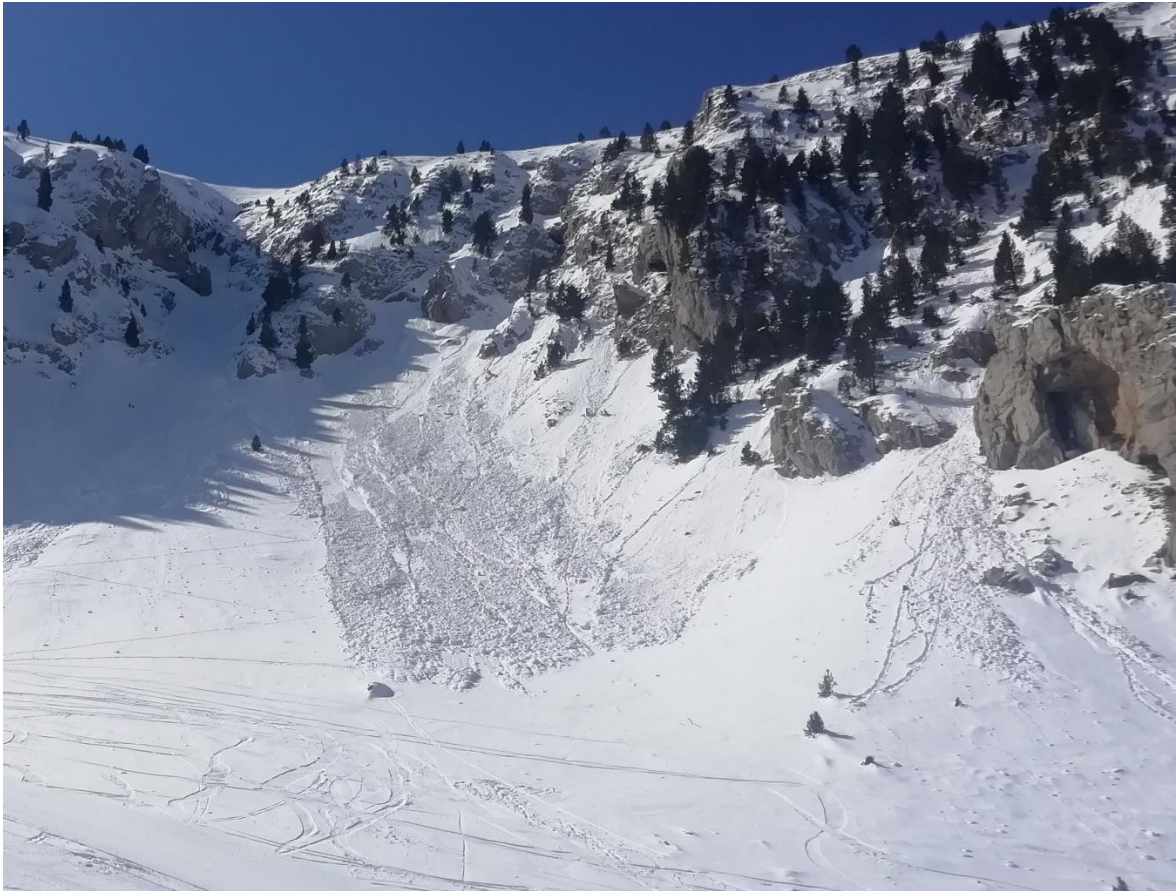
Purgues de neu humida observades divendres, 1 d'abril, a Les Pedrusques (Moixeró), posteriors a la nevada d'uns 15 cm, aproximadament, acumulats entre dimarts i dimecres.