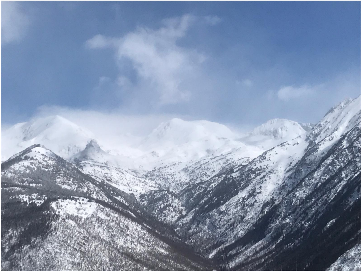
Mantell uniforme amb la neu recent de la darrera nevada fins a fons de vall, des de Tavascan mirant cap a la vall de Noarre i Certascan, diumenge 3 d'abril.